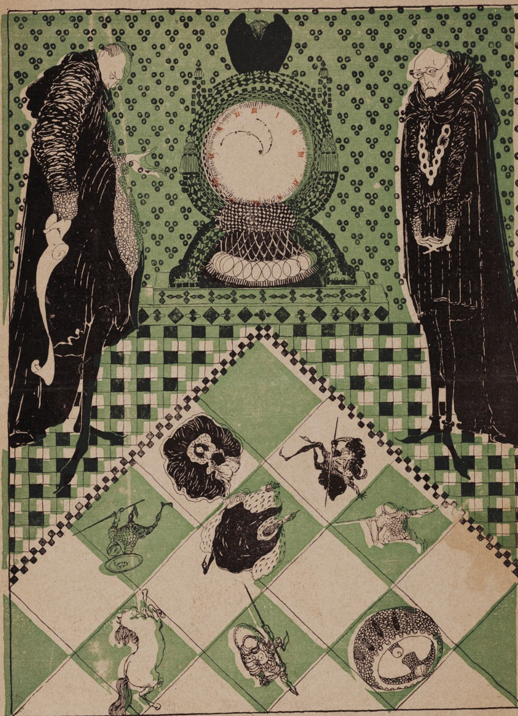
Шахматный турнирь. Страничка изъ средневьковаго альбома. Рис. худ. П.