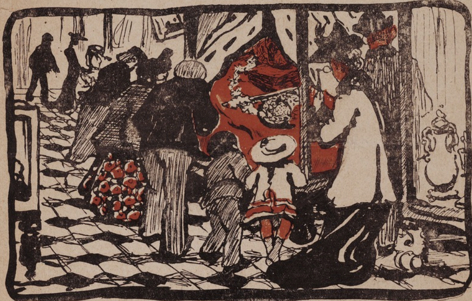
Въ музеѣ рѣдкостей. Рис. худ. Д.