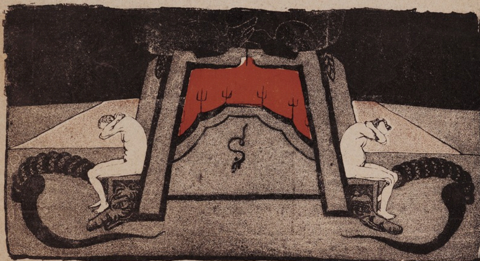
Врата адовы. Рис. худ. К.