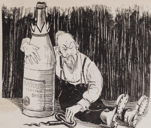
Изъ типовъ Максима Горькаго.

— Одна только ты скоро у меня, голубушка, и останешься.