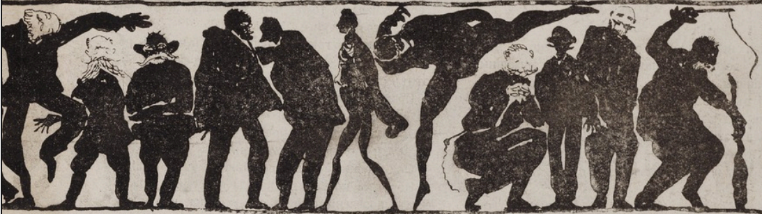
10 силуэтов . . . 4