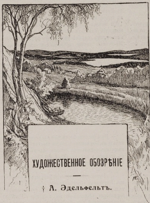
Рис. А. Эдельфельта

Грустное чувство охватывает и щемит душу, когда великія и грандіозныя картины остаются незамѣченными, когда мимо нихъ проходятъ люди съ безразличнымъ чувствомъ буржуазной сытости и съ тупостью остаются равнодушными къ окружающему.