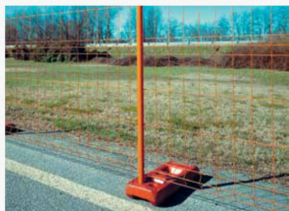
Plots en béton renforcé ou plots plastique