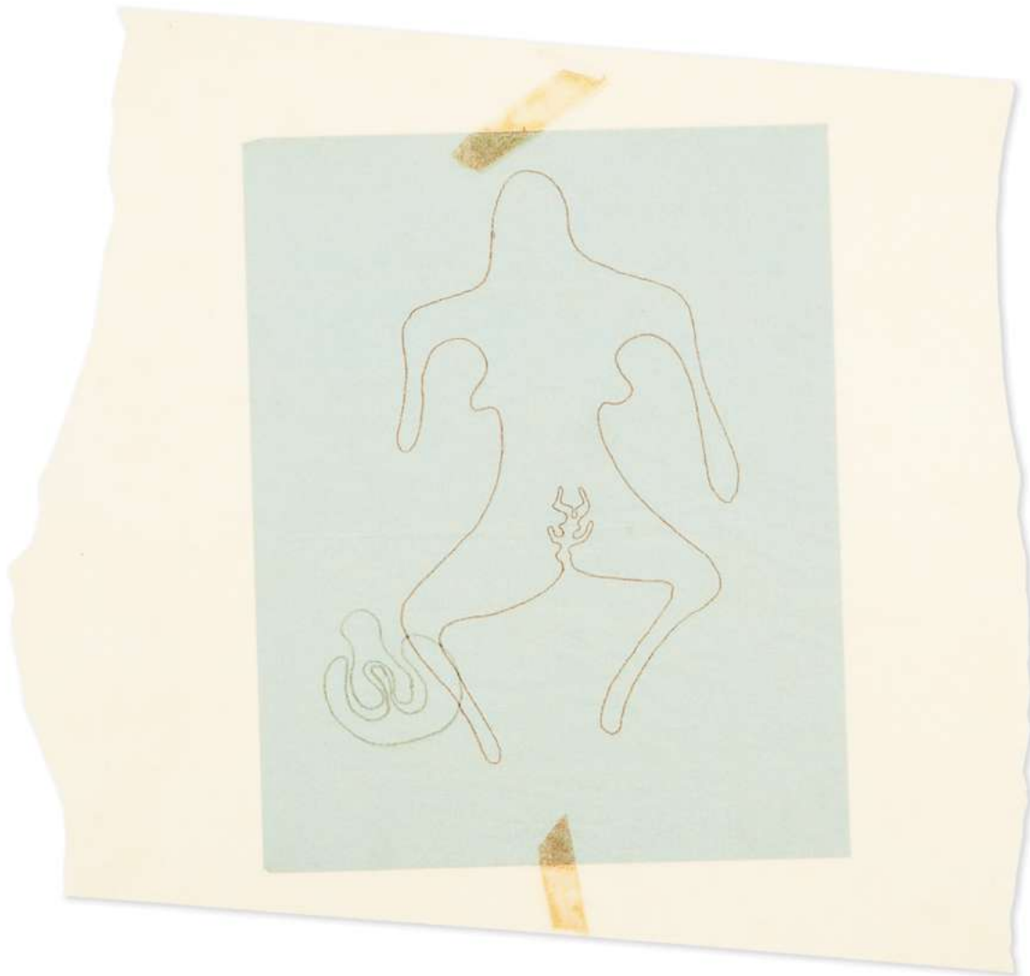
Ernesto Neto. Untitled , 1989-90.