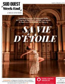
Manchette H 30 X L 125