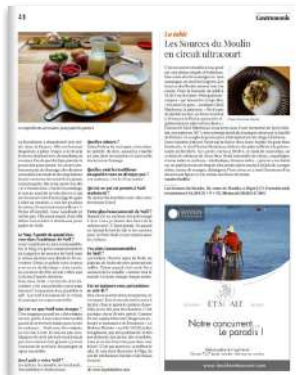
1/4 page hauteur H 157 X L 128