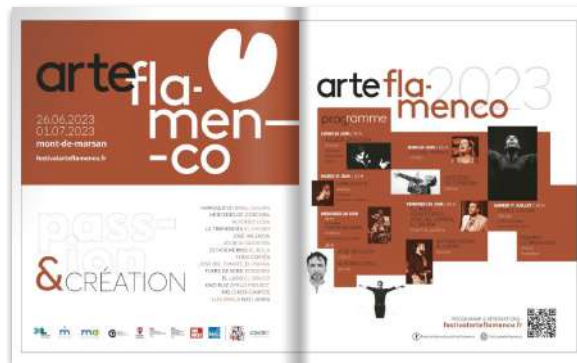
Pano centrale H 323 X L 545