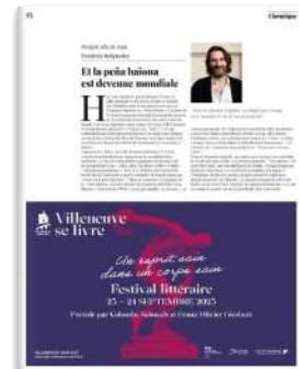
1/2 page H 157 X L 260,5