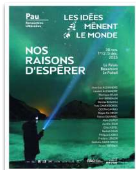
Page, 2ème de couv ou DER H 323 X L 260,5