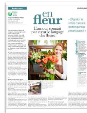
Page publi chartée H 323 X L 260,5