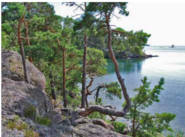
Vätterstranden är dramatisk vid Kagen

Västanvik består av 421 fastigheter. Därutöver finns inom området "samfällid" mark och egendom; vägar, skog, ängsmark, hamnar, va-anläggning m.m. Dessa anläggningar är vår gemensamma egendom, som också ska skötas gemensamt. Läs mer om samfälligheten på hemsidan.