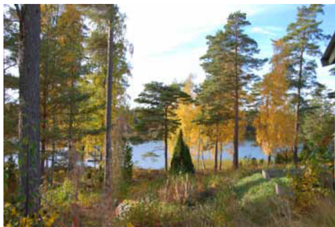
Hämtningsviken vid badet

En samfällighetsförening bygger på att medlemmarna solidariskt bestämmer vad som ska utföras och genomföras, utifrån de regler som gäller i anläggningsbeslut och lagar om samfälligheter. I första hand kan du som medlem vända dig till din områdesvärd med synpunkter på åtgärder och förbättringar. Alla medlemmar kan också via motioner till stämman föreslå mer omfattande åtgärder och förbättringar. Om de beslutade åtgärder kan genomföras gemensamt av medlemmarna, så hålls kostnaderna nere. Områdenas röjdagar, Måndagsklubben och Växtgruppen är exempel på verksamheter som utför viktiga uppgifter till nytta och glädje för alla. Deltag du också! Ju fler som hjälps åt ju enklare blir det att hålla området snyggt och trivsamt. Läs mer om organisationen på föreningens hemsida http://www.vestanvik.se/