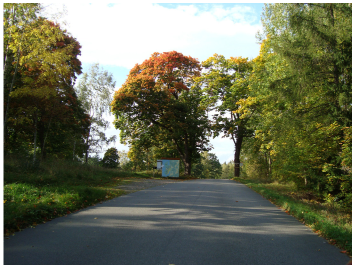
Entrén till Västanvik, vid lönnarna i Rustninge

Styrelsen sköter förvaltningen av Samfälligheten enligt stämmobeslut, anläggningsbeslutet, samfällighetslagen och föreningens stadgar, samt alla övriga tillämpliga lagar och bestämmelser för samfälligheter