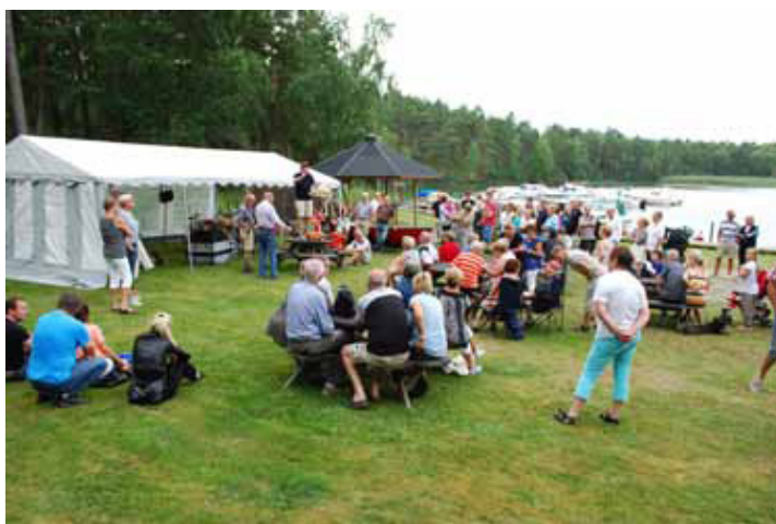
Sommarauktionen i Hämtningsviken

En gång om året, under våren, har Samfällighetsföreningen en stämma (årsmöte). Stämman är det högsta beslutande organet i Samfälligheten. Stämman granskar det gångna årets förvaltning, beslutar om ansvarsfrihet och lägger upp riktlinjerna för framtida förvaltning. Stämman väljer styrelse och övriga funktionärer.