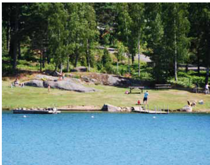
Badet i Hämtningeviken

Det som skiljer Västankvik från många andra samfälligheter är våra stora strövområden. Här finns ett omfattande nät av stigar. Den vandringsled som följer stranden och går runt området är numera en del av Östgötaleden. Välkommen att uppleva natur, hembygdshistoria och naturvärden som hör till det finaste som går att uppleva.