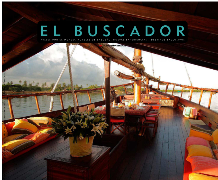
Distribuido para campañas@hormail.com

Empezamos con un crucero por el ARCHIPIÉLAGO LAMU en el Índico a bordo de un velero "dhow" tradicional de 15 metros: el "Tusitiri" ( journeysbydesign.com ). Una experiencia a través de islas desiertas con playas de arena blanca, cenas al fresco y noches durmiendo bajo las estrellas en confortables colchones sobre su cubierta (3.717 euros/noche). * El mundo