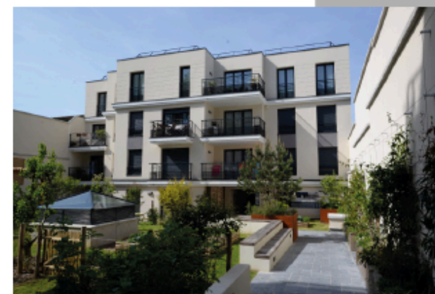
Issy les Moulineaux (92)