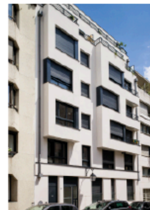
Paris Buttes aux Cailles