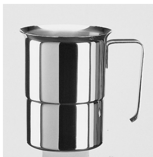
Pot à verser empilable