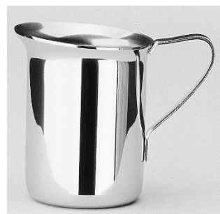
Pot à verser