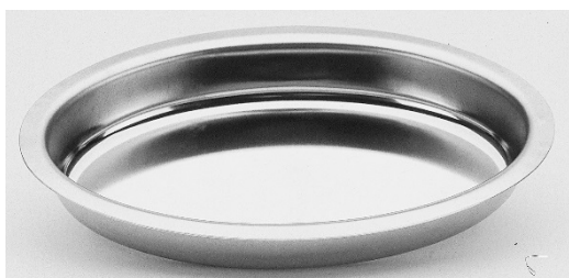
Plat gratin ovale