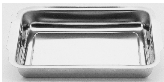
Plat gratin rectangulaire