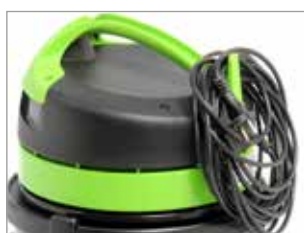
CROCHET POUR CÂBLE