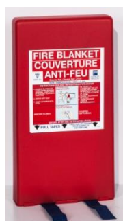
COU 7054 AF 120 x 180 cm