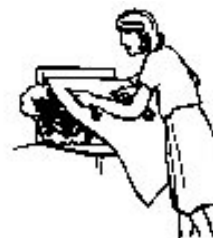
Feux de friteuses