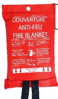
COU 7052 AF 120 x 180 cm