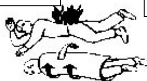
Feux de vêtements