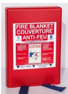
COU 7053 AF 120 x 120 cm