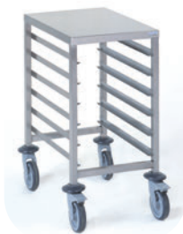
Chariot GN avec tablette supérieure