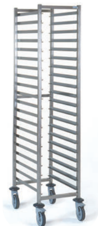
GN 1/1 - 20 niveaux

Les chariots sont construits en acier inox alimentaire, ce qui leur assure robustesse et bonne résistance à la corrosion donc une très grande longévité.