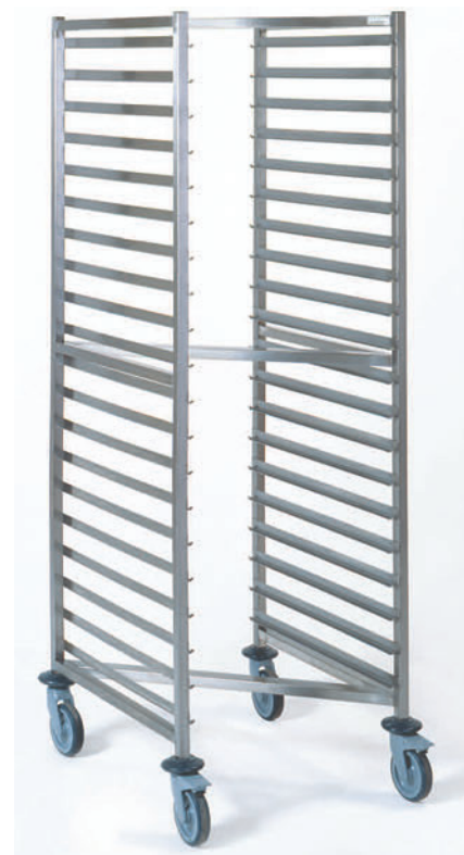
GN 2/1 - 20 niveaux