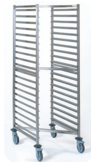
chariot GN encastrable