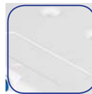
Zone de marquage