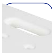
Poignée de portage