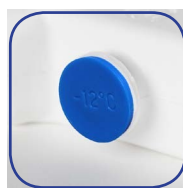
Bouchon soudé par ultrasons