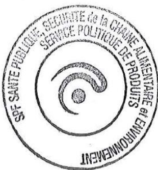
Kathelijne De Ridder "Point Focal Label EU Ecolabel" Organisme Compétent belge