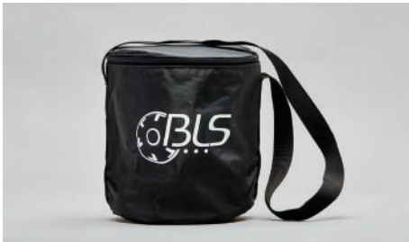
C43 – Sac lavable avec bandoulière.