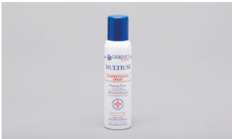
Q409 – Spray désinfectant 150ml.