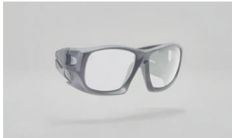
C22 – Monture de lentilles de prescription.