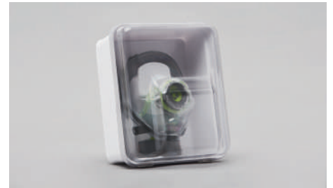
C90 – Conteneur mural.