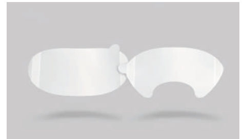
K16 – Film de protection en acétate.