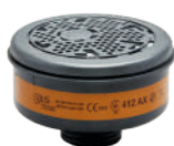
Filtres série BLS 400