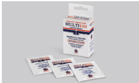
Q530 – Lingettes désinfectantes.