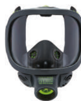
Masques complets BLS 3000