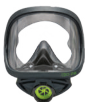
Masques complets BLS 2150 - BLS 2150V