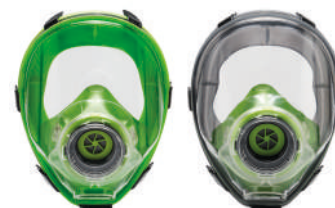
Masques complets BLS 5400 - BLS 5150