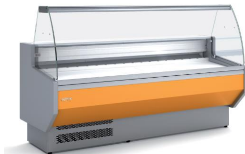
CVED-8-20-C Vitre bombée