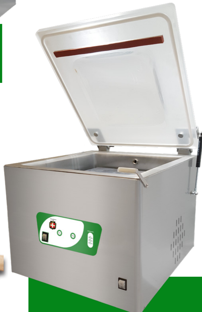
Eco green 405 pompe 20 m 3