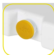
Bouchon soudé par ultrasons