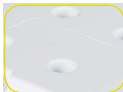
Zone de marquage