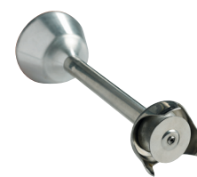
Disque batteur Réf. : AC522