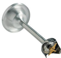
Couteau émulsionneur Réf. : AC530