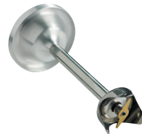
Couteau standard 2 lames Réf. : AC531