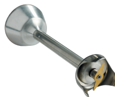
Couteau standard 2 lames Réf. : AC521