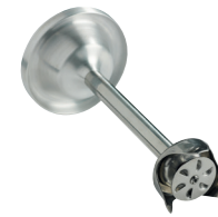
Disque émulsionneur Réf. : AC533