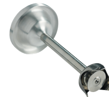
Disque batteur Réf. : AC532