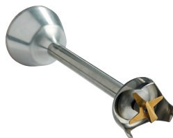
Couteau émulsionneur Réf. : AC520