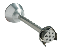
Disque émulsionneur Réf. : AC523