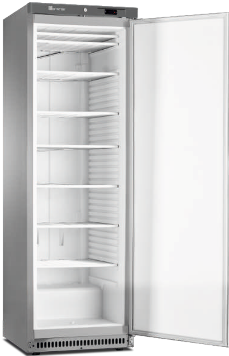
ACE 430 CS A PO