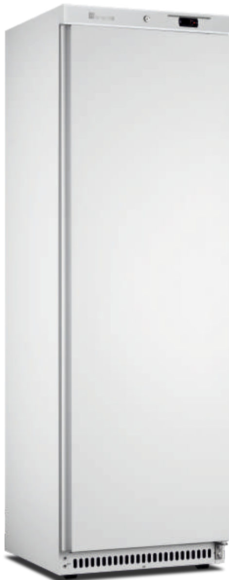
ACE 430 CS PO