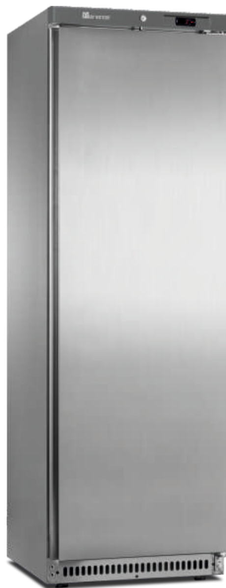
ARV 430 CS A PO