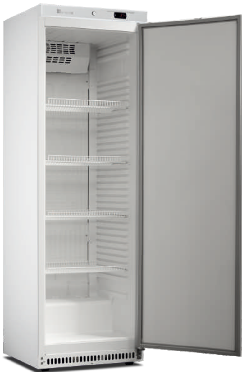
ARV 430 CS PO