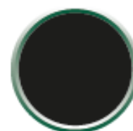
Extérieur laqué noir