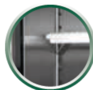
Grilles sur taquets (4 taquets par grille)

Intérieur en aluminium. Cadre de porte noir.