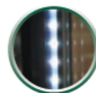
contour de porte lumineux