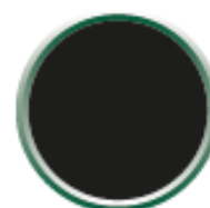
Extérieur laqué noir