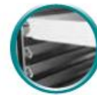
bacs à pâtons (non fourni)