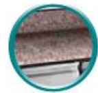
plan de travail granit