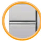
2 tiroirs 1/2 (en option)