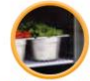
Grilles sur glissières