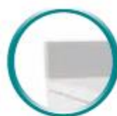
Dosseret H 100 mm