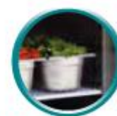
Grilles sur glissières