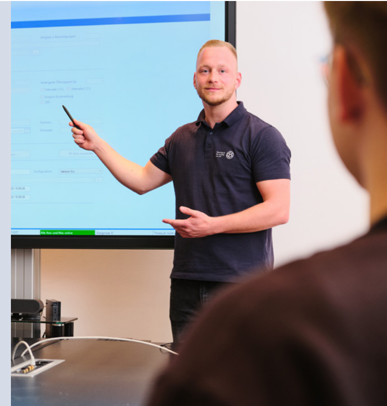
Stand: V 5.0 · DE · 08.2021

Weitere Informationen zum Studiengang: www.fom.de