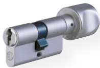
Cylindre à bouton profilé n° 815 UDM Laiton mat nickelé Une fonction de fermeture sur un côté, l'autre côté avec bouton en aluminium, F1, vendu avec diverses formes de bouton (la forme H est représentée)