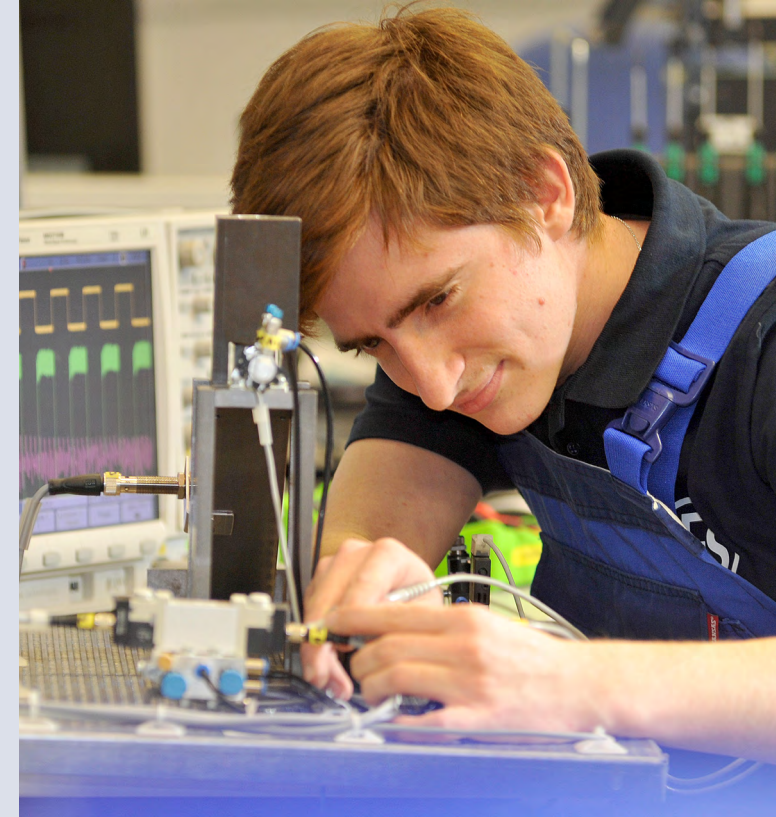
Stand: V.1.0 · DE · 08.2018

Friedrichstraße 243 D-42551 Velbert Tel. +49 (0) 2051-204-0 Fax +49 (0) 2051-204-229 Mail info@ces.eu www.ces.eu