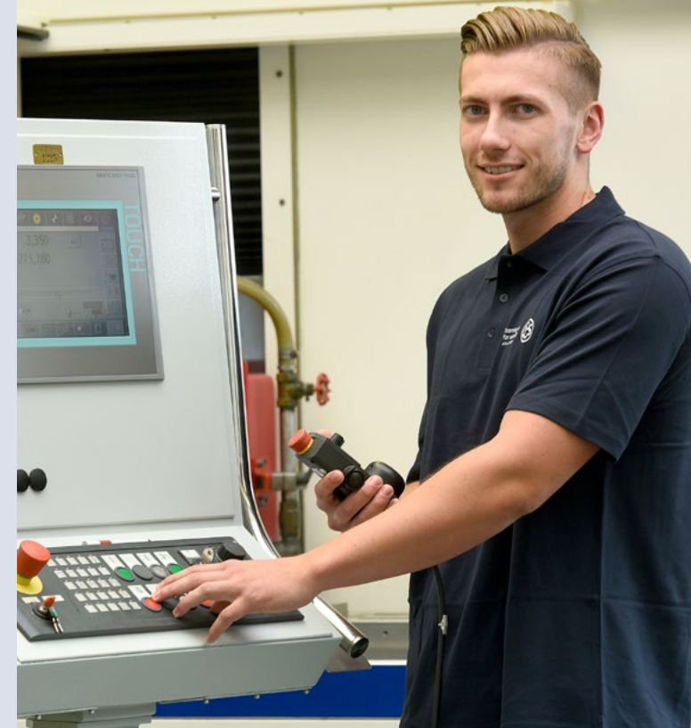
Stand: V 2.0 · DE · 08.2019

Friedrichstraße 243 D-42551 Velbert Tel. +49 (0) 2051-204-0 Fax +49 (0) 2051-204-229 Mail info@ces.eu www.ces.eu