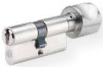
Profil-Knaufzylinder Nr. 815 UDM Messing matt vernickelt eine Seite Schließfunktion, andere Seite Alu-Knauf, NF, diverse Knaufformen erhältlich (abgebildet Form H)