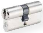
Profil-Doppelzylinder Nr. 810 UDM Messing matt vernickelt