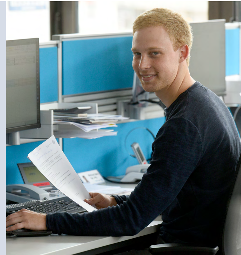
Stand: V.1.0 · DE · 08.2018

Weitere Informationen zum Studiengang: www.fom.de