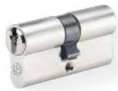
Cylindre européen double n° 810 UDM Laiton mat nickelé