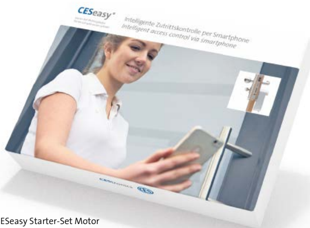
CESeasy Starter-Set Motor