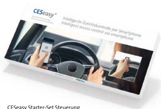
CESeasy Starter-Set Steuerung