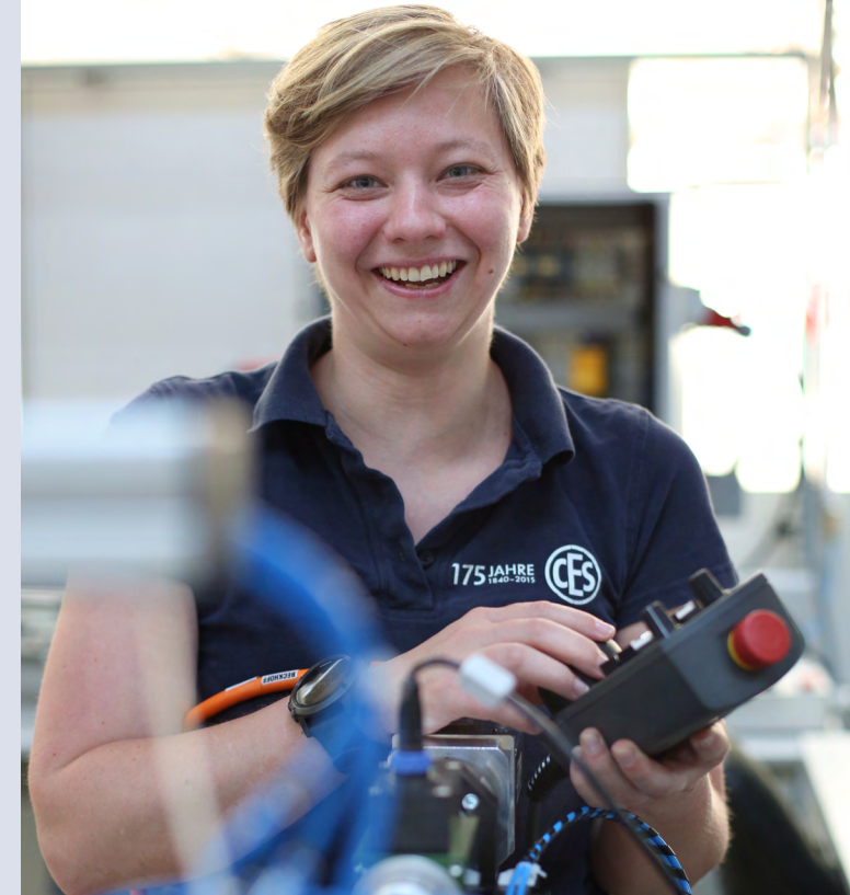
Stand: V.1.0 · DE · 08.2018

Weitere Informationen zum Studiengang: www.hochschule-bochum.de/campus-velbertheilighaus