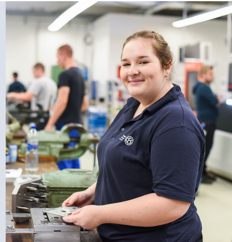
Stand: V 3.0 · DE · 10.2021

Friedrichstraße 243 D-42551 Velbert Tel. +49 (0) 2051-204-0 Fax +49 (0) 2051-204-229 Mail info@ces.eu www.ces.eu