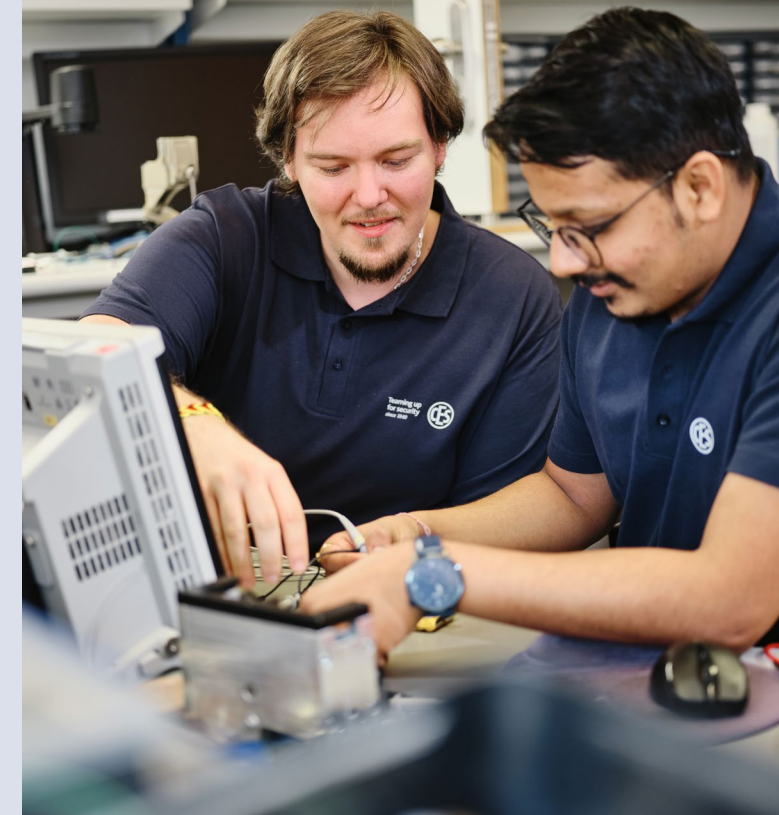
Stand: V.1.0 · DE · 10.2021

Weitere Informationen zum Studiengang: https://www.hochschule-bochum.de/cvh/