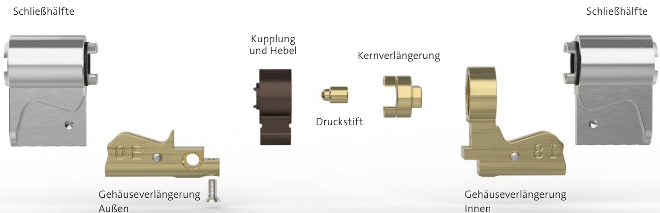
Abbildung zeigt einen Doppelzylinder 812MO + MOKI-08-00 mit der Abmessung 35,5 (Innen) / 27,5 mm (Außen)