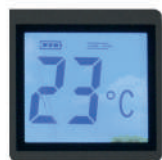
Display digital 1. Indica temperatura de salida del agua. 2. Indica errores. 3. Indicador de falla por montaje inadecuado del ducto de evacuación.