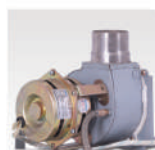
Motor eléctrico Permite extraer los gases de la combustión.