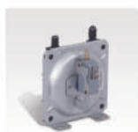
Presostato Control de concentración de monóxido de carbono.