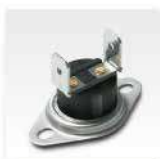
Bimetálico Sistema de seguridad por sobrecalentamiento del agua.