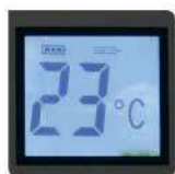
Display digital 1. Indica temperatura de salida del agua. 2. Indicador de falla por montaje inadecuado del ducto de evacuación.