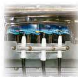
Termopar Sensor de temperatura que apaga el calentador cuando hay ausencia de llama.

Para efectos de instalación por favor verifique el manual de usuario. Especificaciones sujetas a cambios sin previo aviso*.