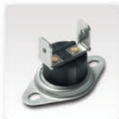
Bimetálico Sistema de seguridad por sobrecalentamiento del agua.