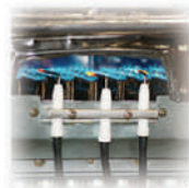
Termopar Sensor de temperatura que apaga el calentador cuando hay ausencia de llama.

Para efectos de instalación por favor verifique el manual de usuario. Especificaciones sujetas a cambios sin previo aviso*.