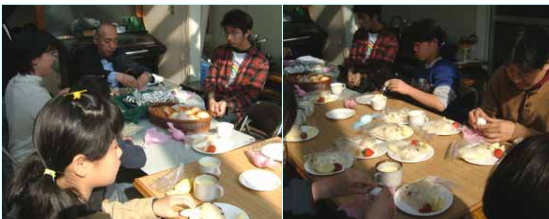
教会学校のお友だちもおいしそうに食べています