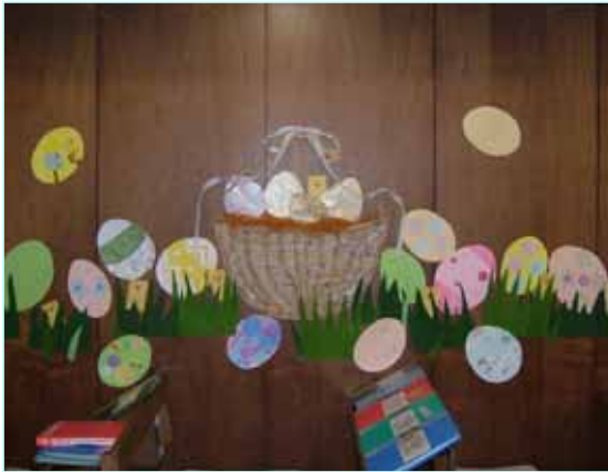
礼拝堂のイースター飾り