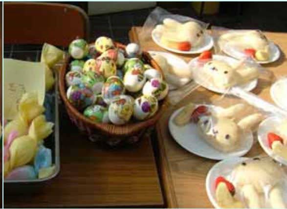
イースターエッグとうさぎパン