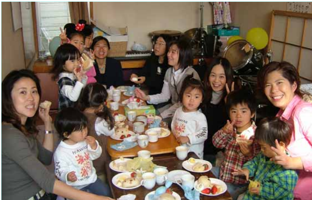
絵本大好きの会に参加のみなさんも楽しそうです