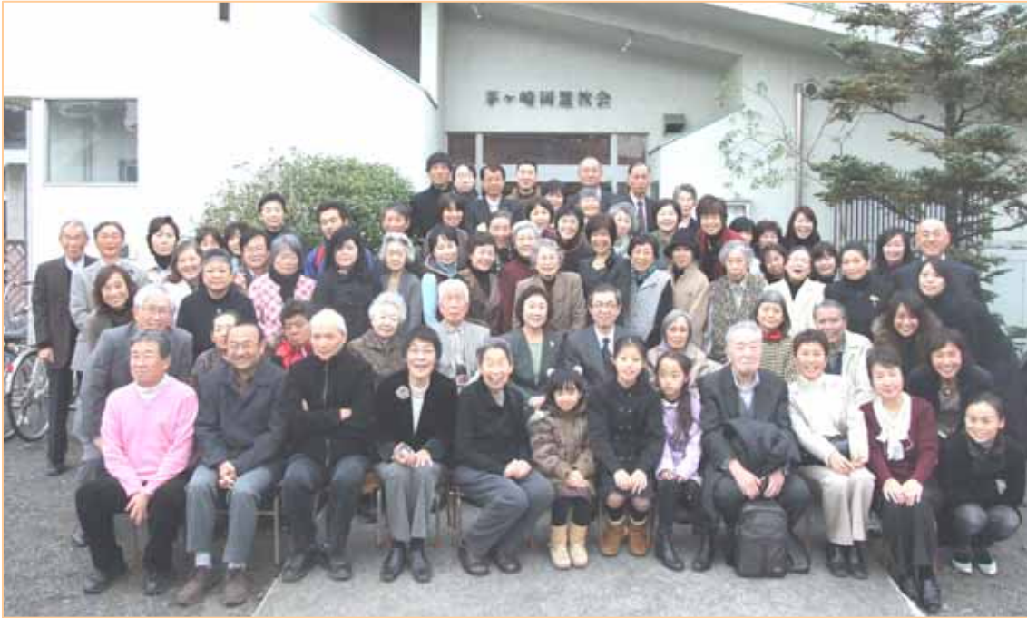
Nov.22nd. 2009 創立 50 周年記念礼拝にて