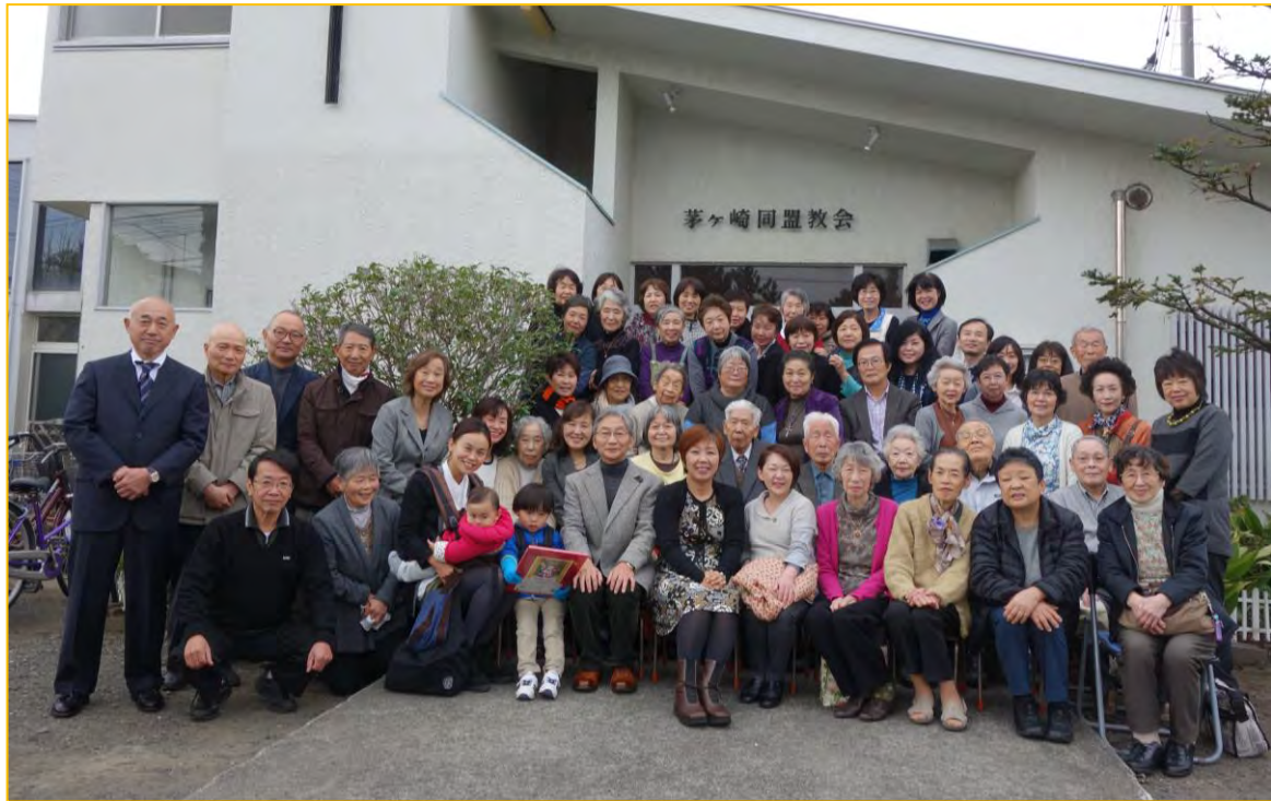
創立 56周年記念(2015 年 11 月 22 日)