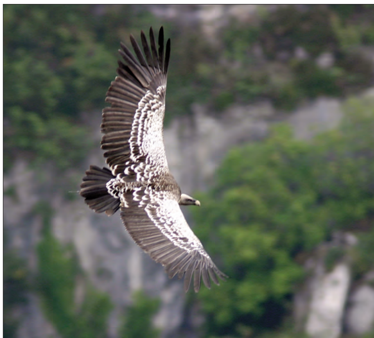
50. Vautour de Rüppell Gyps rueppellii , adulte, Rémuzat (Baronnies), Drôme, septembre 2003. Adult Rüppell's Vulture.