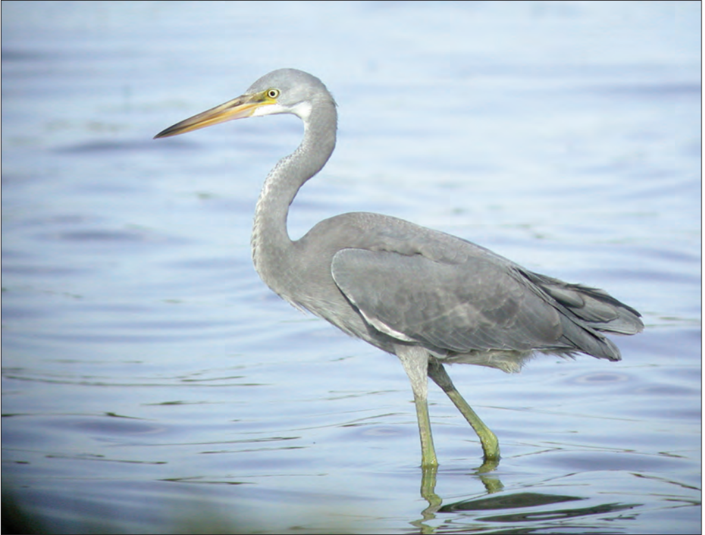
6. Aigrette des récifs Egretta gularis schistacea , adulte, Peyriac-de-Mer, Aude, octobre 2004. Western Reef Egret .