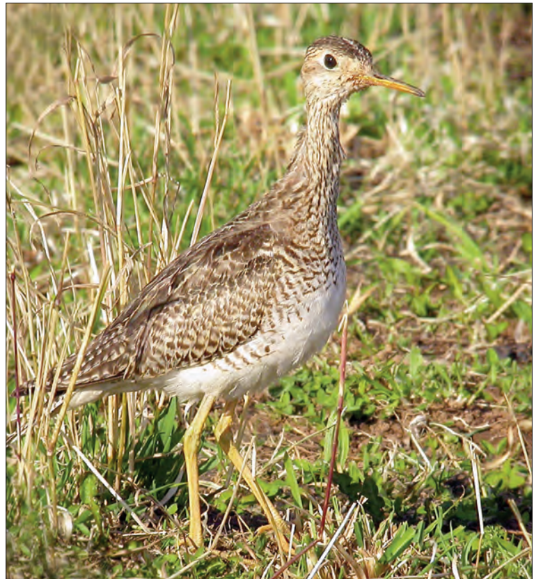
24. Bartramie des champs Bartramia longicauda , 1 er hiver, Crau, Bouches-du- Rhône, décembre 2004. 1st-winter Upland Sandpiper.