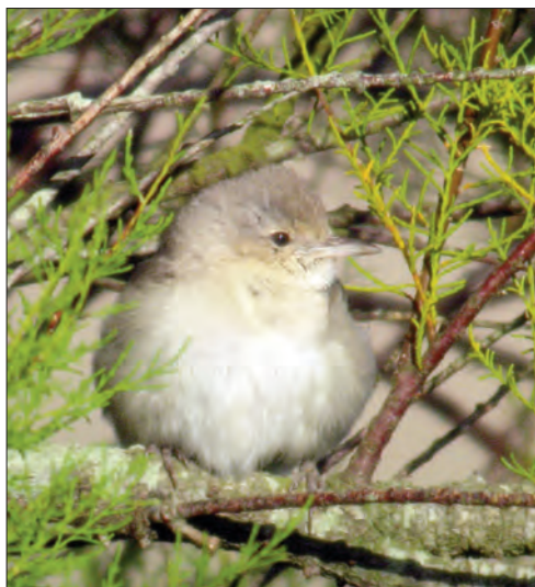
33. Fauvette épervière Sylvia nisoria , 1 er hiver, Ouessant, Finistère, octobre 2004. 1st-winter Barred Warbler.