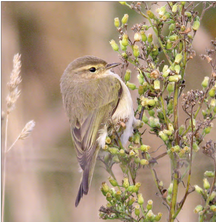
40. Pouillot véloce Phylloscopus collybita de type sibérien, île de Noirmoutier, Vendée, novembre 2004. Siberian Chiffchaff.

(Asie centrale et septentrionale). L'espèce est d'observation annuelle en France depuis 1998 seulement et reste d'une grande rareté, avec en moyenne un ou deux oiseaux par an. L'année 1999 détient le record avec 8 individus ! À noter qu'en 2002, un Pouillot brun avait déjà été observé en octobre en Camargue.