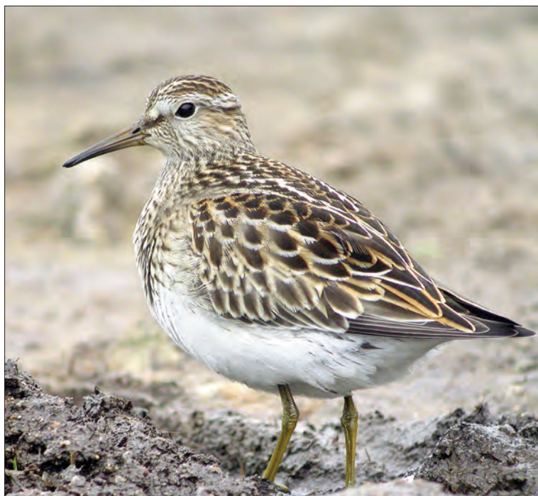
19. Bécasseau tacheté Calidris melanotos , juvénile, Ouessant, Finistère, septembre 2004. Juvenile Pectoral Sandpiper.