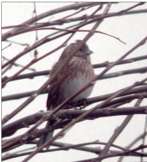
46. Bruant à calotte blanche Emberiza leucocephalos , Audinghen, Pas-de-Calais, novembre 2004 (Guy Flohart). Male Pine Bunting .