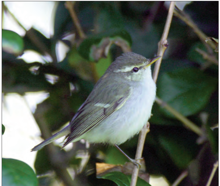
35. Pouillot à pattes sombres Phylloscopus t. plumbeitarsus , Sein, Finistère, octobre 2004 (Jean-Pierre Trévoux). Two-barred Greenish Warbler.

Pas-de-Calais – Audinghen, 28 octobre (G. Flohart).