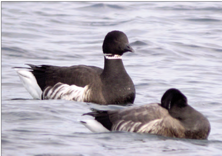
1. Bernache du Pacifique Branta bernicla nigricans , adulte (à gauche) avec une Bernache cravant à ventre sombre B. b. bernicla , Réville, Manche, janvier 2005. Adult Black Brant (left) with Dark-bellied Brent Goose.

Année exceptionnelle pour les grands aigles en France avec, en plus des traditionnels Aigles criards Aquila clanga , le troisième Aigle des steppes A. nipalensis , le huitième Aigle impérial A. heliaca et le septième Aigle ibérique A. adalberti français, en même temps que la première nidification de l'Aigle pomarin A. pomarina .