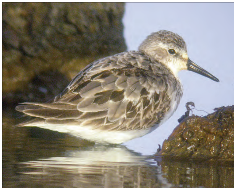
17. Bécasseau semipalmé Calidris pusilla , adulte, Le Fenouiller, Vendée, septembre 2004 (Matthieu Vaslin). Adult Semipalmated Sandpiper.