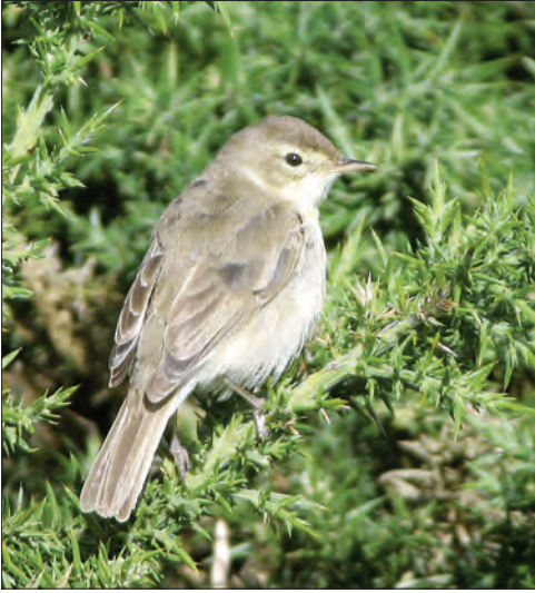
▲ 31. Hypolaïs bottée Hippolais caligata , 1 er hiver, Ouessant, Finistère, octobre 2004 (Miguel Vergès). 1st-winter Booted Warbler.