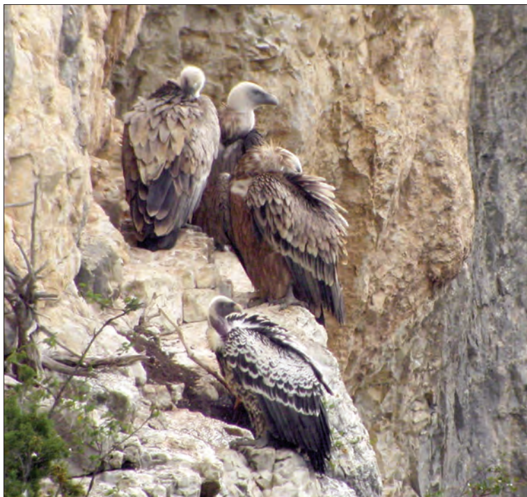
49. Vautour de Rüppell Gyps rueppellii , adulte (en bas) et Vautours fauves G. fulvus , Rémuzat (Baronnies), Drôme, octobre 2003. Adult Rüppell's with Griffon Vulture.