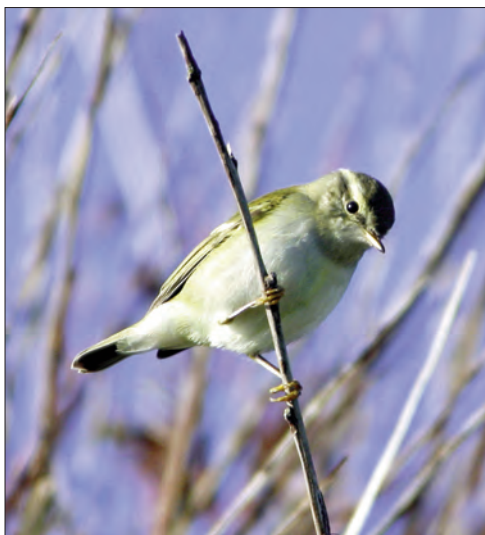
34. Pouillot à grands sourcils Phylloscopus inornatus , Ouessant, Finistère, octobre 2004 (Miguel Vergès). Yellow-browed Warbler.