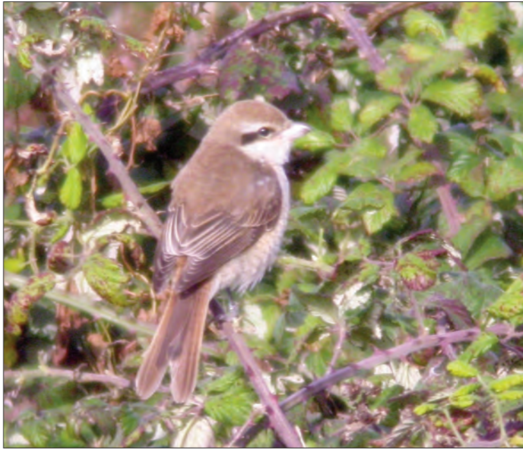
▼41. Pie-grièche brune Lanius cristatus , 1 er hiver, île de Noirmoutier, Vendée, novembre 2004. 1st-winter Brown Shrike.