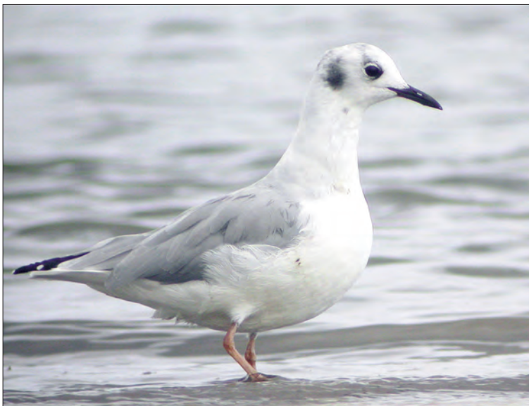
26. Mouette de Bonaparte Larus philadelphia , adulte, Lampaul-Plouarzel, Finistère, septembre 2004. Bonaparte's Gull.

(Amérique du Nord). Il s'agit du premier cas d'hivernage complet de cette espèce en France, ce qui a permis à de nombreux observateurs de se déplacer pour venir la voir.