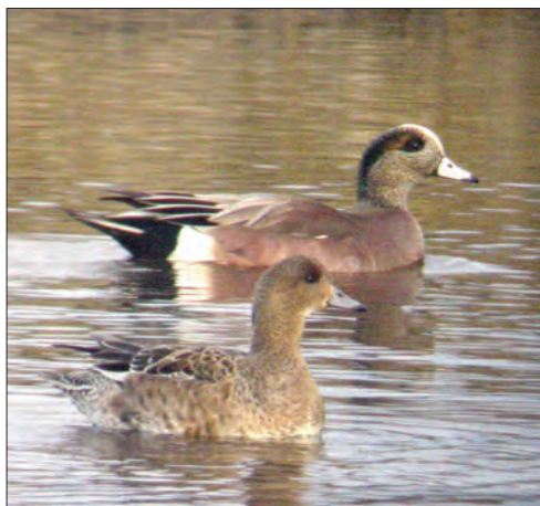
2. Canard à front blanc Anas americana , mâle et Canard siffleur Anas penelope femelle, baie de Goulven, Finistère, février 2005 (Vincent Palomares). Male American Wigeon with female Wigeon.