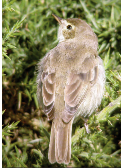
► 32. Hypolaïs bottée Hippolais caligata , 1 er hiver, même oiseau que sur la photo 31 (Matthieu Vaslin). 1st-winter Booted Warbler.