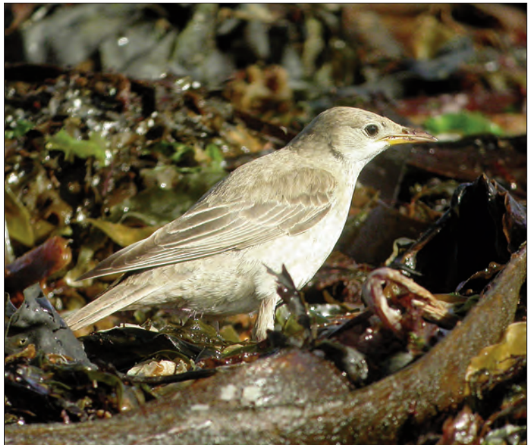
44. Étourneau roselin Sturnus roseus , juvénile, Sein, Finistère, septembre 2004 (Aurélien Audevard). Juvenile Rose-coloured Starling.