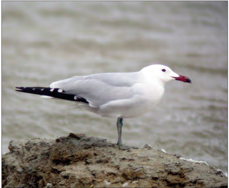
27. Goéland d'Audouin Larus audouinii , 3 e été, Lapalme, Aude, avril 2004 (Julien Gonin). 3rd-summer Audouin's Gull.