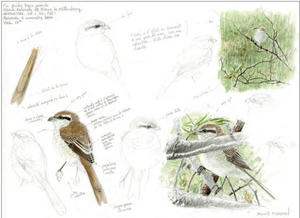
▼42. Pie-grièche brune Lanius cristatus , 1 er hiver, île de Noirmoutier, Vendée, novembre 2004 (Benoît Perrotin). 1st-winter Brown Shrike.