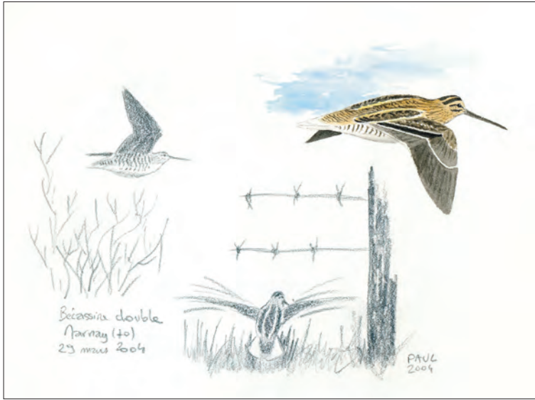
23. Bécassine double Gallinago media , Marnay, Haute-Saône, mars 2004 (Jean-Philippe Paul). Great Snipe.