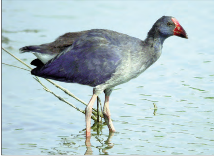
13. Talève sultane Porphyrio porphyrio , immature, Canet, Pyrénées- Orientales, août 2004 (Thierry Tancrez). Immature Purple Gallinule.