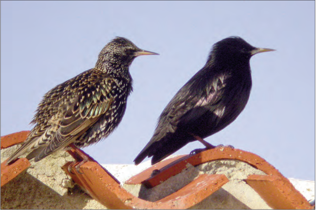
43. Étourneau unicolore Sturnus unicolor , mâle (à droite) et Étourneau sansonnet S. vulgaris , île de Noirmoutier, Vendée, décembre 2004 (Matthieu Vaslin). Male Spotless Starling (right) with Common Starling.