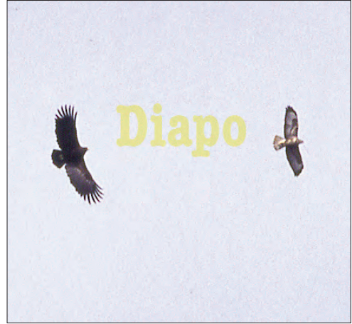
▲ 11. Aigle criard Aquila clanga , adulte et Buse variable Buteo buteo , Lapeyrouse, Ain, mars 2004. Adult Greater Spotted Eagle with Common Buzzard.