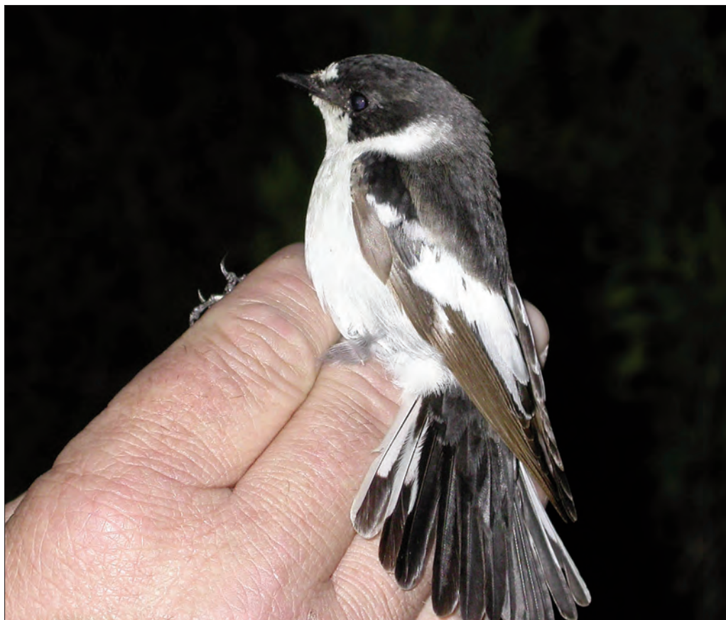
36 à 39. Gobemouche à demi-collier Ficedula semitorquata , mâle 1 er été, Porquerolles, Hyères, Var, avril 2004 (Régis André & Pascal Miguet). 1st-summer male Semi-collared Flycatcher