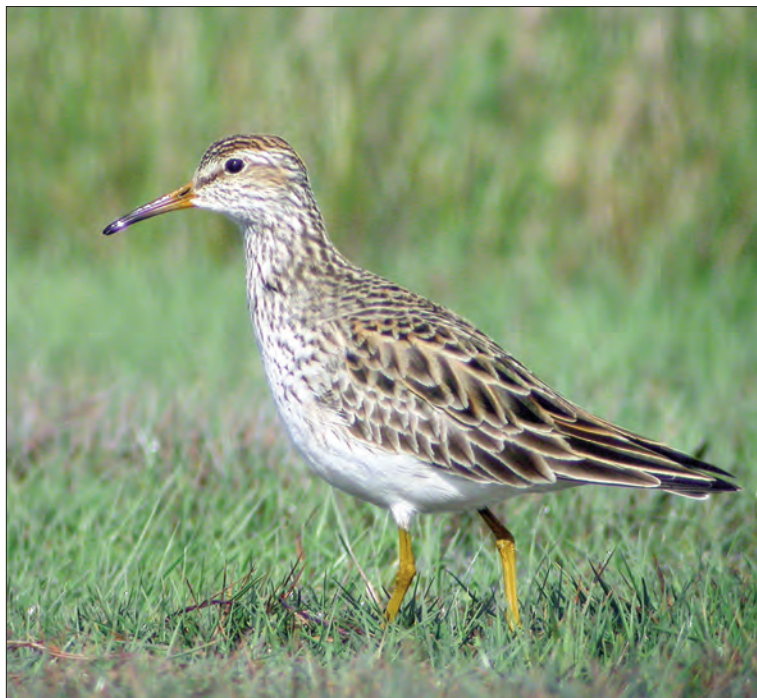
18. Bécasseau tacheté Calidris melanotos , adulte, Ouessant, Finistère, mai 2004 (Aurélien Audevard). Adult Pectoral Sandpiper.