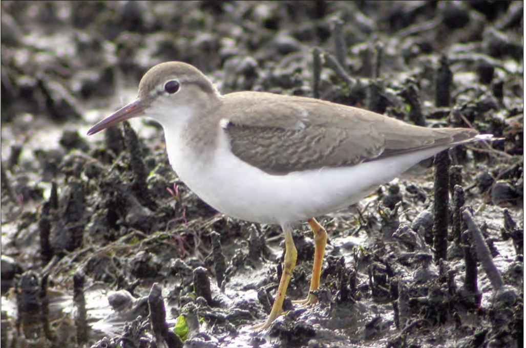
25. Chevalier grivelé Actitis macularius , juvénile, Tréffiagat, Finistère, août 2004. Spotted Sandpiper.