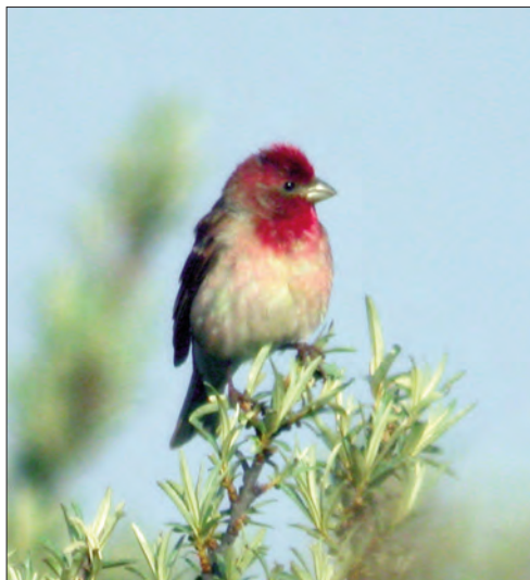
45. Roselin cramoisî Carpodacus erythrinus , mâle, Hemmes-de-Marck, Pas-de-Calais, juin 2004. Male Common Rosefinch .