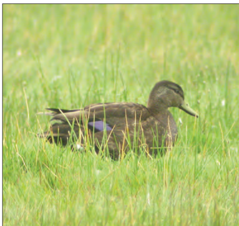
3. Canard noir Anas rubripes , mâle adulte, marais du Kun, île d'Ouessant, Finistère, mai 2004 (Aurélien Audevard). Adult male Black Duck.