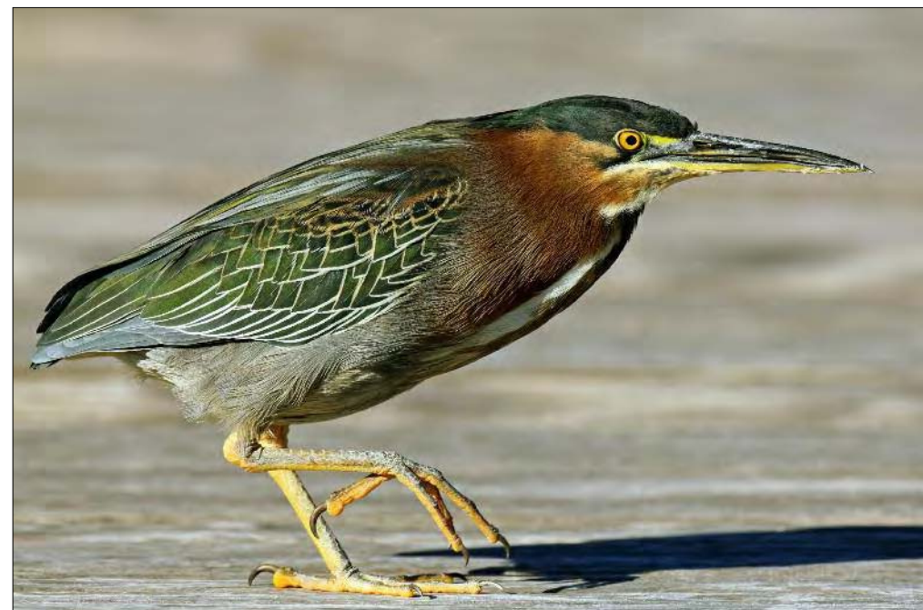
11. Héron vert Butorides virescens , adulte, Bouches-du-Rhône, décembre 2008 (Julien Vêque). Adult Green Heron.