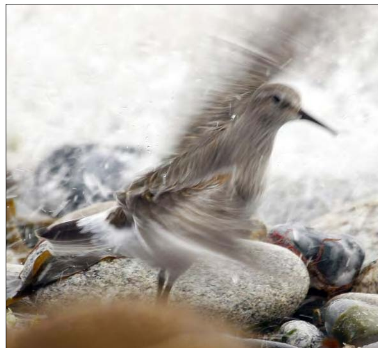
22. Bécasseau de Bonaparte Calidris fuscicollis , juvénile, Finistère, octobre 2008 (Yvon Le Corre). Juvenile White-rumped Stint.