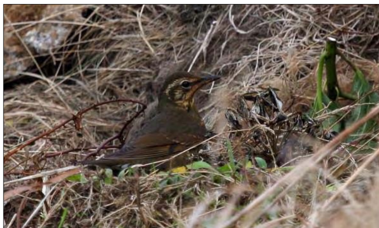
39. Grive de Sibérie Zoothera sibirica , femelle, Sein, Finistère, octobre 2008 (Willy Raitière). Female Siberian Thrush.