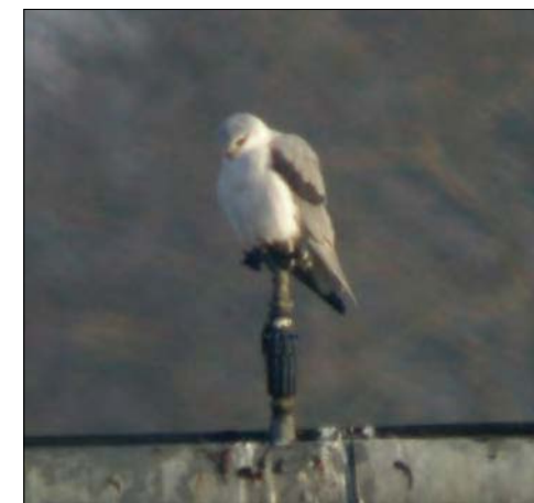
7. Élanion blanc Elanus caeruleus , adulte, Cher, février 2008 (Johann Pitois). Black-shouldered Kite .