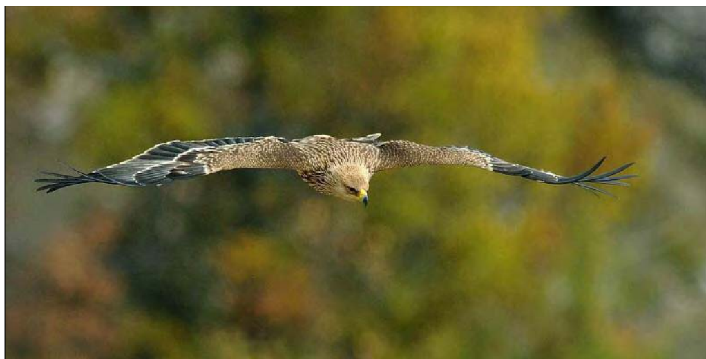
15. Aigle impérial Aquila heliaca , 1 er hiver, Lozère, novembre 2008 (Bruno Berthémy). First-winter Imperial Eagle .