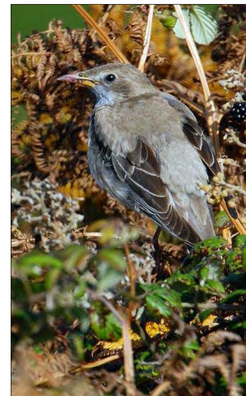
51. Étourneau roselin Sturnus roseus , juvénile, Finistère, octobre 2008. Juvenile Rose-coloured Starling.