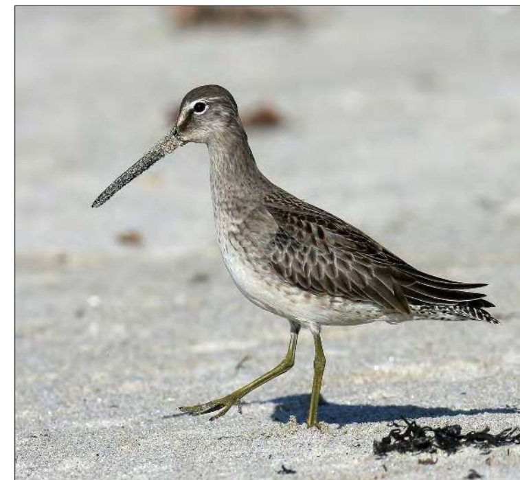
27. Bécassin à long bec Limnodromus scolopaceus , juvénile, Finistère, octobre 2008 (Thierry Quélenec). Juvenile Long-billed Dowitcher.

(Amérique du Nord). L'oiseau de Loire-Atlantique fournit un nouveau cas d'hivernage pour la France et s'est montré à nombre d'amateurs venus le voir... Celui de Plouarzel – magnifiquement photographié – a été trouvé en un lieu et à une date parfaitement classiques, les bécassins arrivant plus tard dans l'automne que la majorité des autres limicoles nord-américains.