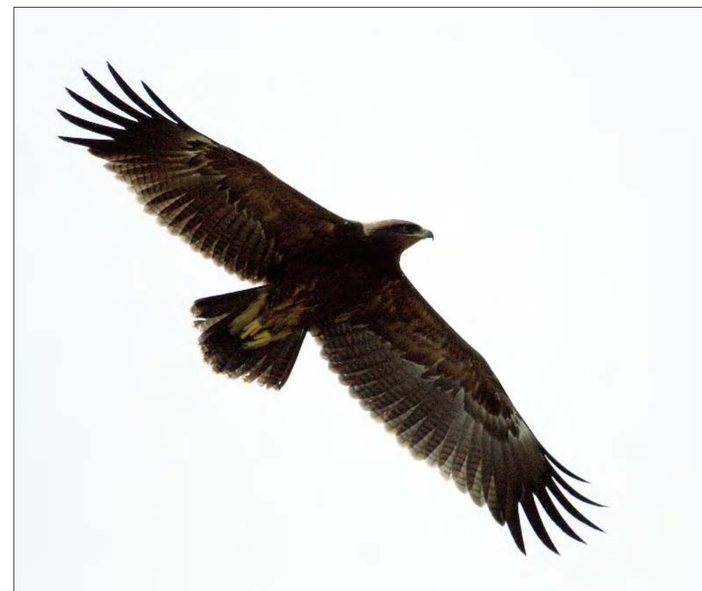
14. Aigle pomarin Aquila pomarina , juvénile, Bouches-du-Rhône, septembre 2008 (Thomas Galewski). Juvenile Lesser Spotted Eagle .

(De la Pologne à la Sibérie orientale). Une donnée s'ajoute pour l'année 2006, qui compte désormais quatre nouvelles arrivées. Cet oiseau avait été bagué au nid le 20 juin 2006 en Biebrza, Pologne (source : G. Maciorowski, T. Mizera). L'autopsie pratiquée a révélé qu'il était apparemment mort d'épuisement (P. Grisser & L. Labatut, comm. pers.) et les mensurations confirment qu'il s'agit d'un mâle. L'année 2008 compte 14 données pour 7 nouveaux oiseaux, les adultes de l'Ain et des Landes n'ayant pas été comptabilisés, puisque de retour sur des sites déjà fréquentés en 2006 et 2007. En Camargue, 4 oiseaux sont considérés comme nouveaux, avec les précautions d'usage... Au marais de Vigueirat, Bouches-du-Rhône, les deux individus semblent les mêmes qu'en 2007. Il faut ajouter à ces chiffres les résultats obtenus lors de la traversée de notre pays par « Tönn », un jeune Aigle criard équipé d'une balise sur son nid en Estonie (V. encadré). L'oiseau est arrivé en France par le sud-ouest allemand le 26 octobre et a quitté le pays par les Pyrénées-Orientales le 16 novembre. Sa balise a émis un signal de position à 66 reprises entre ces deux dates, en 21 communes et 10 départements différents. Une formidable aventure, riche en enseignements (V. « En direct du CHN » dans le présent numéro).