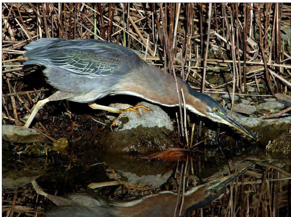
9. Héron vert Butorides virescens , 2 e hiver, Bouches-du-Rhône, février 2008 (Frank Dhermain). Second-winter Green Heron.