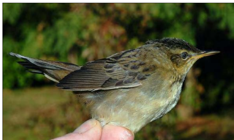
40. Locustelle de Pallas Locustella certhiola , Lot-et- Garonne, octobre 2008 (RN Étang de la Mazière). Pallas's Grasshopper Warbler.