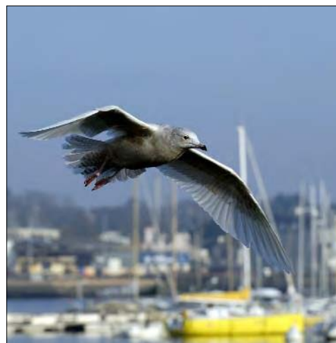
31. Goéland à ailes blanches Larus glaucooides , 1 er hiver, Finistère, janvier 2008 (Nidal Issa). First-winter Iceland Gull.