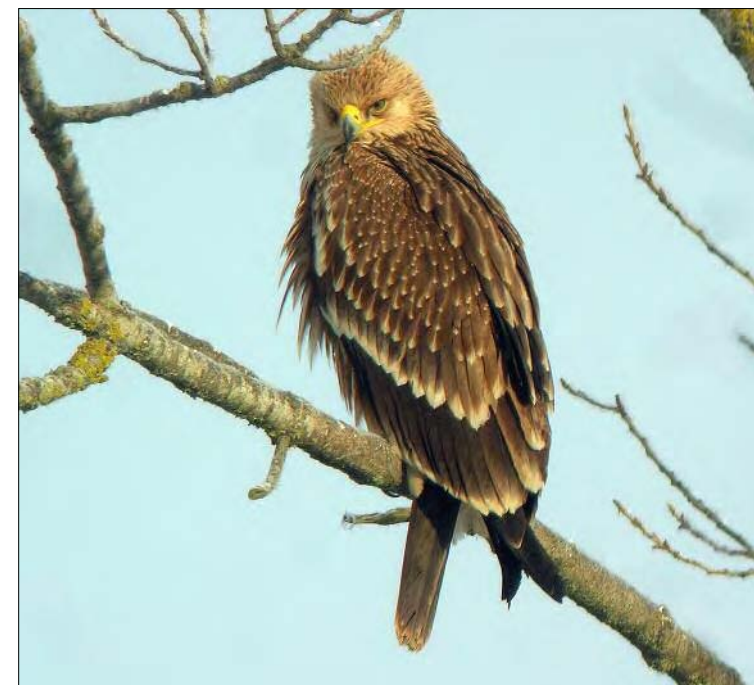
16. Aigle impérial Aquila heliaca , 1 er hiver, Cantal, décembre 2008 (Romain Riols). First-winter Imperial Eagle .

2007 Bouches-du-Rhône – Arles : Camargue, la Chassagne, phot., du 17 au 25 avril (Y. Kayser, A. Faure, B. Olson et al. ). (Amérique du Nord). Un an après son premier Pluvier bronzé, la Camargue en accueille un autre en 2007, portant le total à cinq mentions françaises pour cette année-là. En 2008, deux données ont été obtenues, dont une première pour la Gironde, ce qui est parfaitement conforme à la moyenne annuelle.