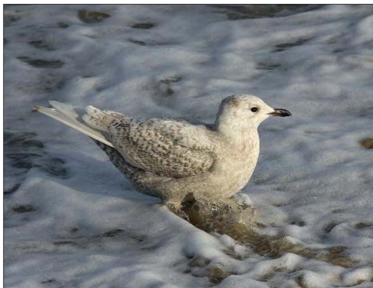
1. Goéland à ailes blanches Larus glaucoides , 1 er hiver, Pas-de-Calais, janvier 2008 (Julien Boulanger). First-winter Iceland Gull.

déjà parues. Cela permettra aussi de tenir le rythme actuel de parution du rapport annuel, et de rester ainsi au plus près de l'actualité ornithologique. À noter aussi que les documents photographiques obtenus par les observateurs non découvreurs peuvent être des compléments précieux aux fiches déjà reçues. Ils sont donc les bienvenus !