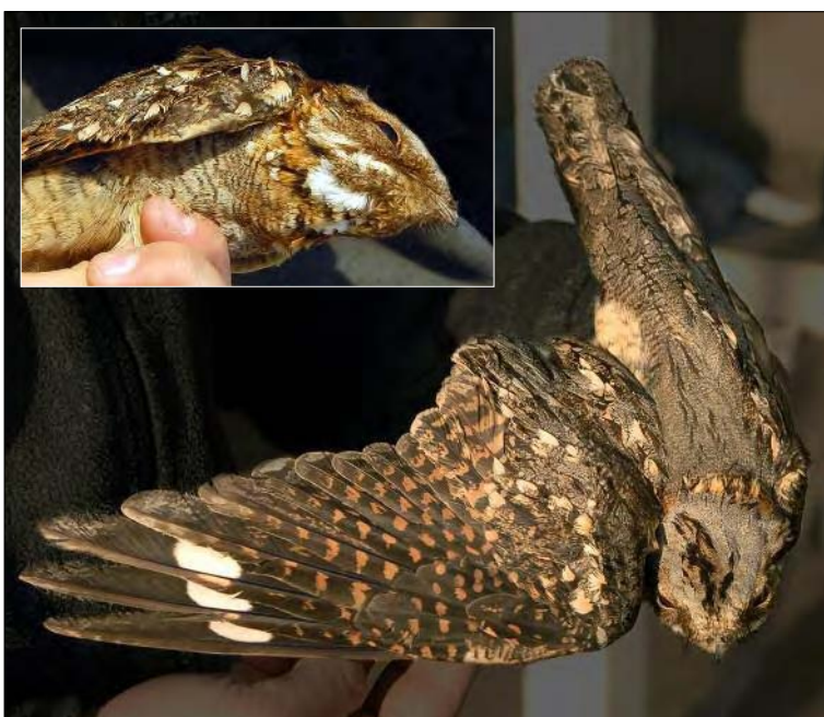
34 & 35. Engoulevent à collier roux Caprimulgus ruficollis , Camargue, Bouches-du-Rhône, avril 2008 (Thomas Blanchon). Red-necked Nightjar .

Vendée – Île de Noirmoutier: Barbâtre, polder de Sébastopol, mâle ad., phot., apparié à une Sterne caugek S. sandvicensis , produit un poussin hybride à l'envol, du 6 mai au 18 juillet (M. Vaslin et al. ). (Côte pacifique, de la Californie au Mexique). Il s'agit du mâle bagué en 2007 au Banc d'Arguin, Gironde, et sans doute de celui déjà vu le 9 mai 2007 sur l'île de Noirmoutier (V. Ornithos 15-5: 332).