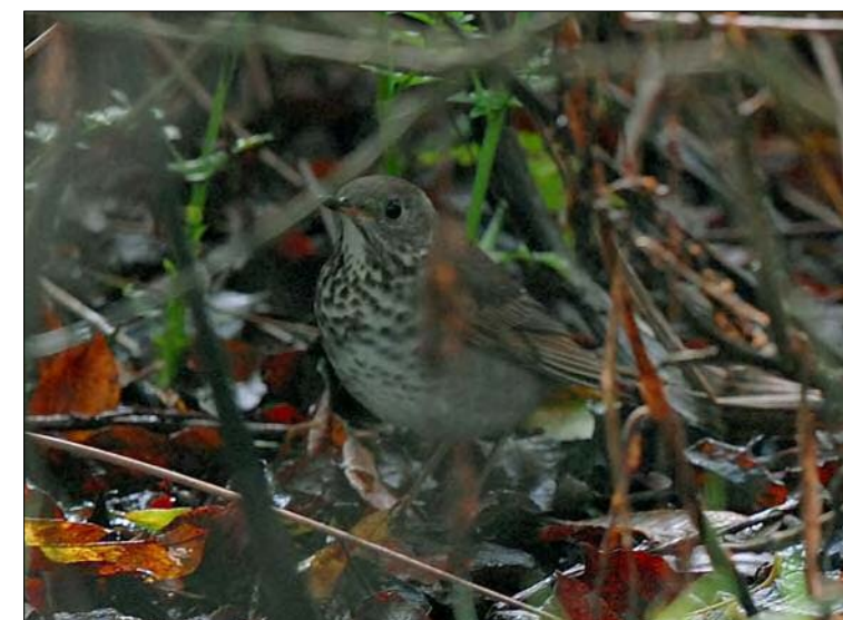
39. Grive à joues grises Catharus minimus , 1 er hiver, Finistère, octobre 2007. First-winter Grey-cheeked Thrush .

(Amérique du Nord, extrême-est de la Sibérie). Quatrième mention française de l'espèce, après celle du 20 octobre 1974 en Vendée, puis du 22 au 25 octobre 1986 et du 12 au 14 octobre 2002, déjà à Ouessant.