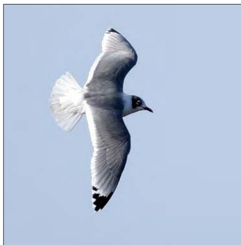
30. Mouette de Franklin Larus pipixcan , 2 e été, Finistère, septembre 2008 (Yvon Le Corre). Second-summer Franklin's Gull.