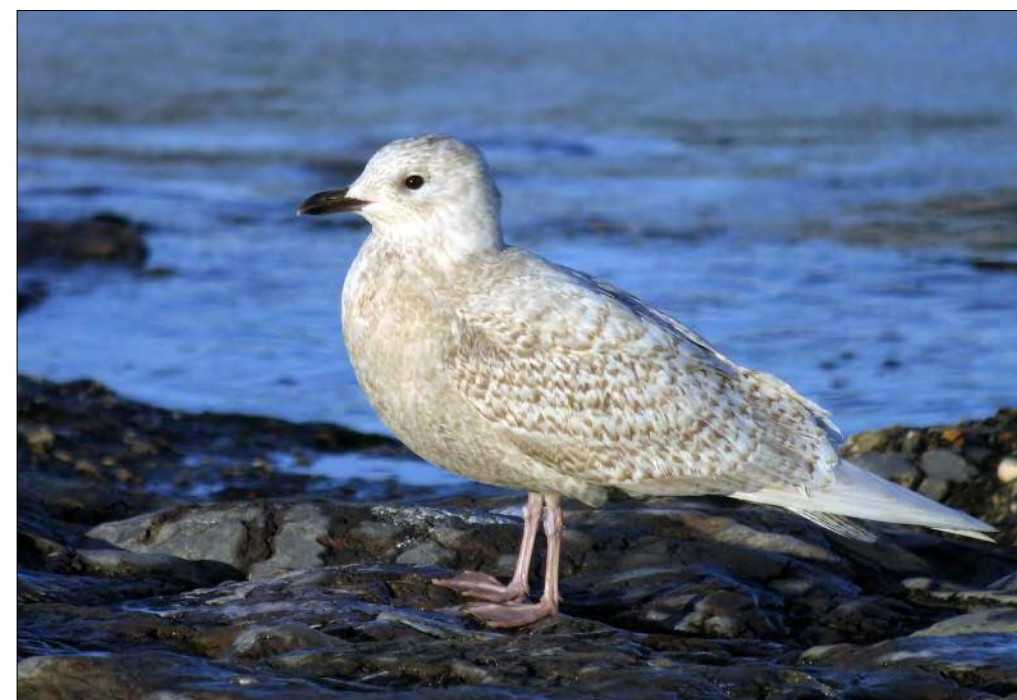
36. Goéland à ailes blanches Larus glaucooides , 1 er hiver, Pas-de-Calais, janvier 2008 (Thierry Tancrez). First-winter Iceland Gull .