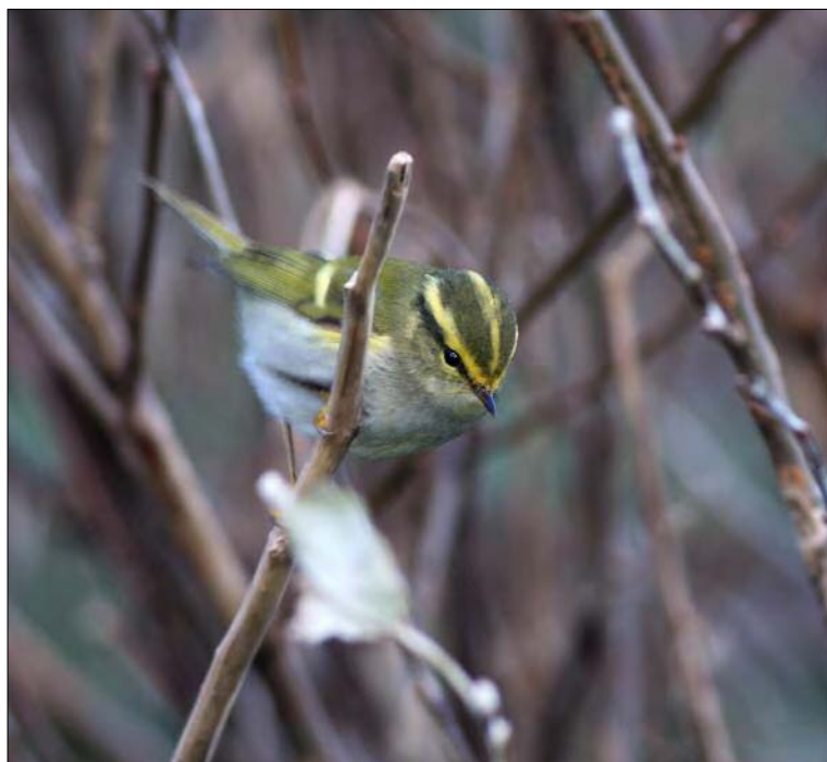
43. Pouillot de Pallas Phylloscopus proregulus , Finistère, octobre 2008 (Corentin Kermarrec). Pallas's Leaf Warbler .