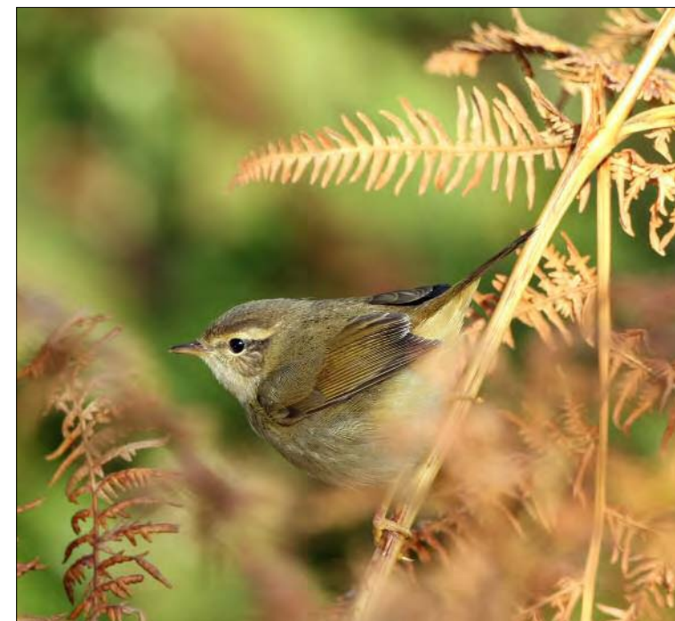
46. Pouillot de Schwarz Phylloscopus schwarzi , Finistère, octobre 2008. Radde's Warbler .