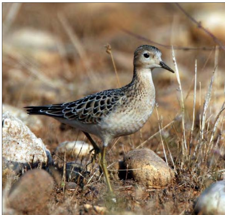
25. Bécasseau rousset Tryngites subruficollis , juvénile, Crau, Bouches-du-Rhône, septembre 2008 (Thomas Perrier). Juvenile Buff-breasted Sandpiper.