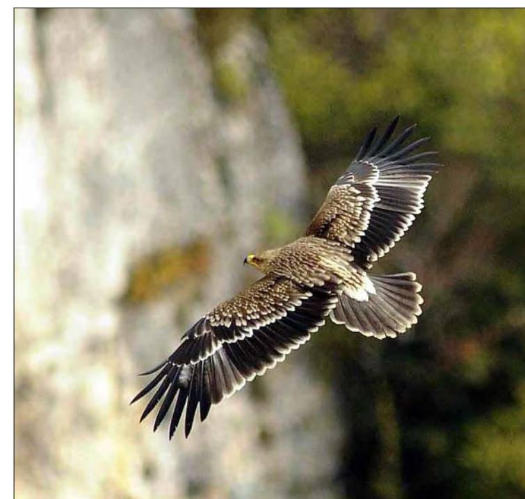
17. Aigle impérial Aquila heliaca , 1 er hiver, Lozère, novembre 2008. First-winter Imperial Eagle .