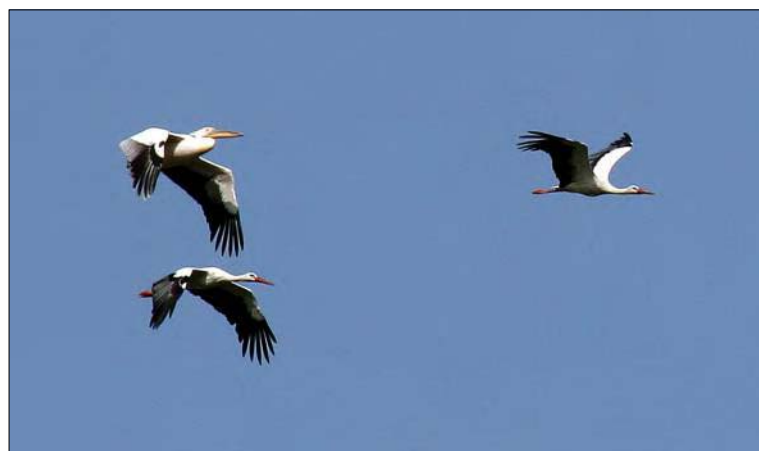
50. Pélican blanc Pelecanus onocrotalus , adulte, Ardèche, septembre 2008. White Pelican with White Storks .

(Europe du Sud-Est, Afrique, Asie de l'Ouest et du Sud-Ouest). Deux données en 2008, l'une concernant un oiseau présent dans l'estuaire de la Loire depuis 2005 (V. Ornithos 14-5: 301) et l'autre un migrateur intégré à un vol de Cigognes blanches Ciconia ciconia . Celui-ci a également été repéré au défilé de Fort l'Écluse, Haute-Savoie, le 8 septembre et à Gruissan, Aude, le 12 septembre. Le même oiseau accompagnant à nouveau des cigognes était de retour en France les 25 et 26 février 2009, après son séjour hivernal en Espagne... (V. note dans le présent numéro).