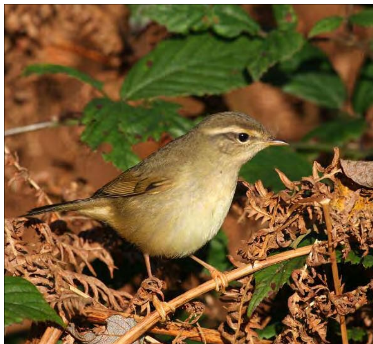
44. Pouillot de Schwarz Phylloscopus schwarzi , Finistère, octobre 2008 (Christian Kerihuel). Radde's Warbler .