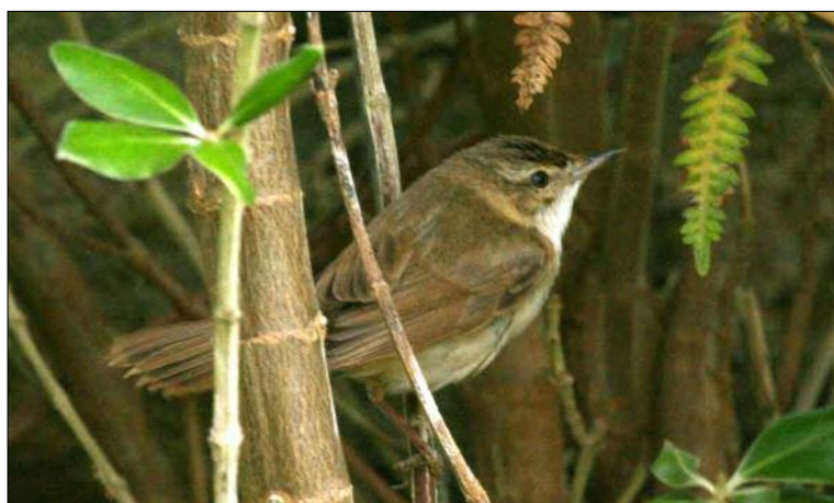
41. Rousserolle isabelle Acrocephalus agricola , 1 er hiver, Sein, Finistère, octobre 2008 (Willy Raitière). First-winter Paddyfield Warbler.