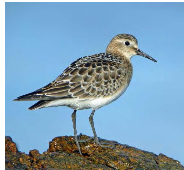
24. Bécasseau de Baird Calidris bairdii , juvénile, Finistère, septembre 2008 (Aurélien Audevard). Juvenile Baird's Sandpiper.