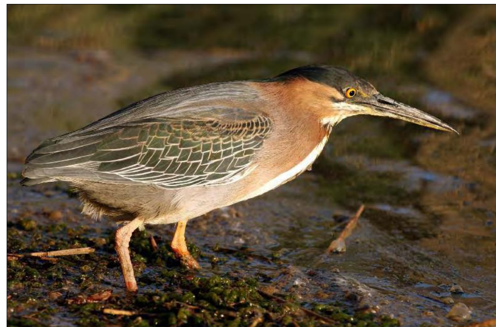
10. Héron vert Butorides virescens , 2 e hiver, Bouches-du-Rhône, avril 2008 (Frank Dhermain). Second-winter Green Heron.

NDLR. Pour des raisons de mise en pages, ces quatre photos de Héron vert ont été inversées horizontalement. C'est donc le côté gauche de l'oiseau qui est visible ici, et non le droit. Noter l'évolution du plumage en 2 ans.