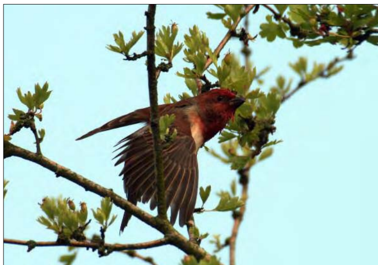
47. Roselin cramoisi Carpodacus erythrinus , mâle, Nord, mai 2008 (Christophe Capelle). Male Scarlet Rosefinch.