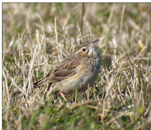
37. Pipit de Godlewski Anthus godlewski , 1 er hiver, Manche, janvier 2008 (Sébastien Provost). First-winter Blyth's Pipit .