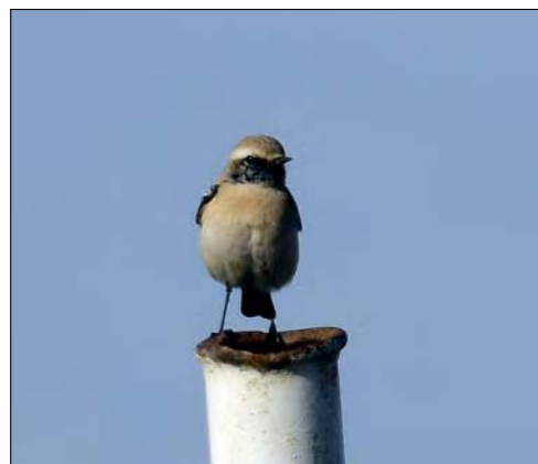
38. Traquet du désert Oenanthe deserti , mâle, Loire-Atlantique, octobre 2008 (Nidal Issa). First-winter mâle Desert Wheatear .

(De la Pologne et de la Turquie à l'Asie centrale). Le Finistère avait déjà accueilli deux oiseaux en 2006, à des dates très similaires. Il s'agit en revanche d'une première pour le Tarn. Plus globalement, avec un total de 11 oiseaux entre 2005 et 2008, la fréquence croissante de l'espèce en France semble bien se confirmer.