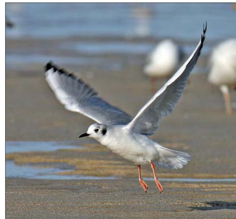
32. Mouette de Bonaparte Larus philadelphia , adulte, Finistère, octobre 2008. Adult Bonaparte's Gull.

Finistère – Île d'Ouessant : baie de Lampaul, 1 er hiver, phot., du 11 au 13 janvier (A. Audevard et al. ) ; Concarneau, 3 ind. de 1 er hiver et 1 ind. de 2 e hiver, phot., du 19 janvier au 3 avril (N. Issa, A. Liger, E. Sansault, S. Nédellec et al. ), 1 er hiver, phot., du 28 décembre au 10 février 2009 (P.-J. Dubois, E. Rousseau et al. ) ; Le Conquet : la Ria, 1 er hiver, phot., du 25 janvier au 6 février (B. Griad), le port : 2 e année, phot., du 6 avril au 1 er juin au moins (A. Audevard) ; Douarnenez, 1 er hiver, phot., 29 février (S. Mauvieux) ; Fouesnant, 1 er hiver, phot., 14 mars puis