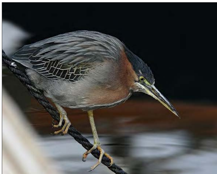
8. Héron vert Butorides virescens , 1 er hiver, Bouches-du-Rhône, décembre 2006 (Thomas Perrier). First-winter Green Heron.

NDLR. Pour des raisons de mise en pages, ces quatre photos de Héron vert ont été inversées horizontalement. C'est donc le côté gauche de l'oiseau qui est visible ici, et non le droit. Noter l'évolution du plumage en 2 ans.