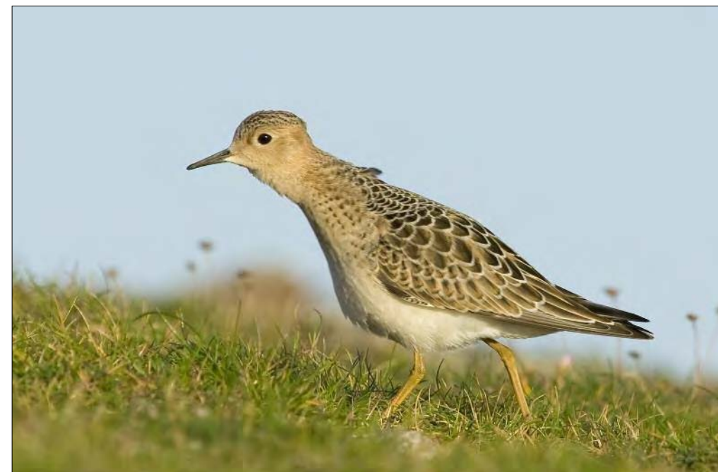
26. Bécasseau rousset Tryngites subruficollis , juvénile, Finistère, septembre 2008 (Aurélien Audevard). Juvenile Buff-breasted Sandpiper.

Maine-et-Loire – Saint-Mathurin-sur-Loire : La Grande Levée, juv., phot., vidéo, du 17 au 28 septembre (R. Provost, J.-C. Beaudoin, E. Beslot, A. Fossé et al. ).