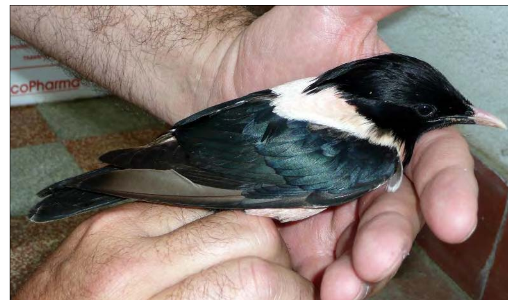
42. Étourneau roselin Sturnus roseus , femelle, Vendée, juin 2008. Female Rose-coloured Starling.

(Sud-est des Balkans, Turquie, Moyen-Orient). Voici enfin la seconde mention française de cette pie-grièche, à une date proche de la précédente, du 18 avril 1961 dans les Alpes-Maritimes. La localité n'est pas surprenante, le site ayant déjà apporté nombre de surprises venues de l'est de la Méditerranée.