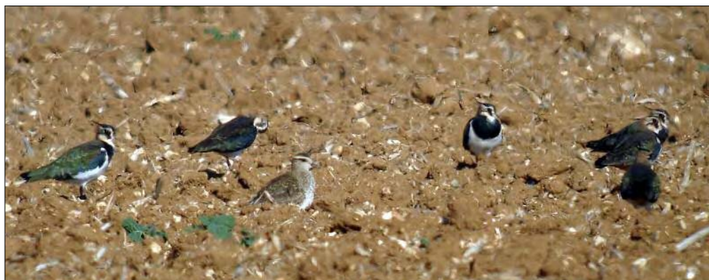
18. Vanneau sociable Vanellus gregarius (premier plan), Seine-et-Marne, octobre 2008 (Bernard Bougeard). Sociable Plover (foreground).