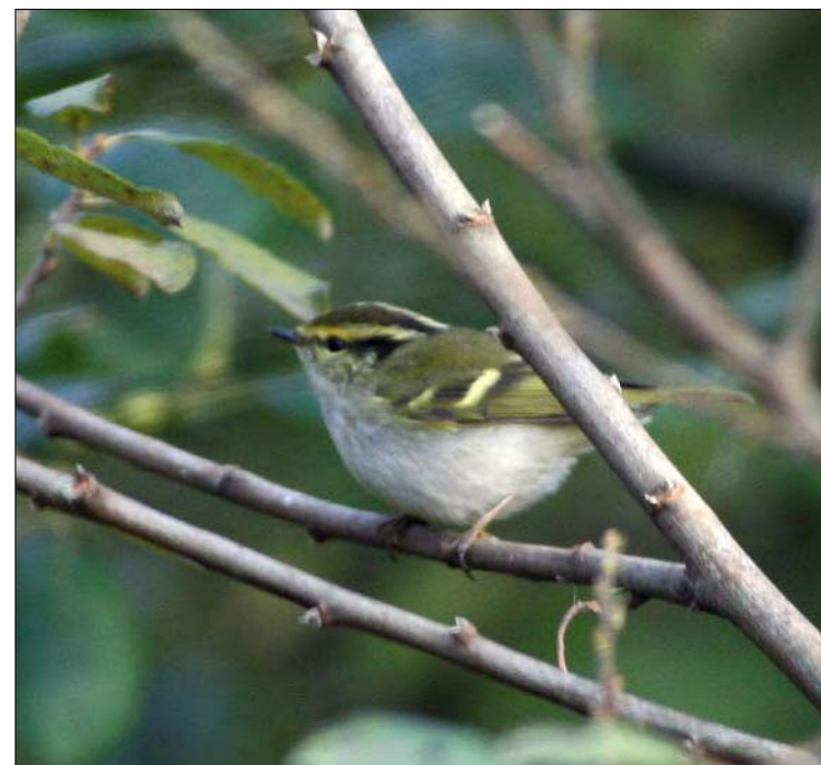
45. Pouillot de Pallas Phylloscopus proregulus , Nord, novembre 2008 (Quentin Dupriez). Pallas's Leaf Warbler .