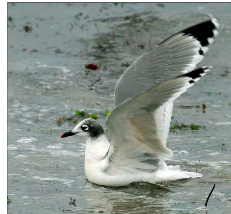
33. Mouette de Franklin Larus pipixcan , 2 e hiver, Vendée, octobre 2008 (Matthieu Vaslin). Second-winter Franklin's Gull.