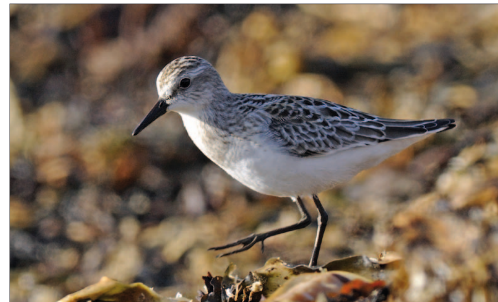
8. Bécasseau semipalmé Calidris pusilla , juvénile, Ouessant, Finistère, octobre 2013. Juvenile Semipalmated Sandpiper .

(Amérique du Nord). Avec trois Bécasseaux semipalmés, 2013 est une bonne année après 2012 qui avait été une année blanche pour l'espèce. Si les Landes accueillent ce bécasseau pour la première fois, les deux autres observations ont été effectuées dans le département qui compte le plus de données.