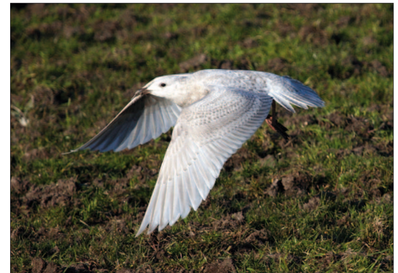
20. Goéland de Kumlien Larus glaucoideus kumlieni , 1 er hiver, Guérande, Loire-Atlantique, février 2013. First-winter Kumlien's Gull.

Bécasseau semipalmé Calidris pusilla – Gironde – La Teste-de-Buch: réserve naturelle du Banc d'Arguin, 1 re année?, 26 septembre (la description n'a pas permis d'éliminer une autre espèce de bécasseau).