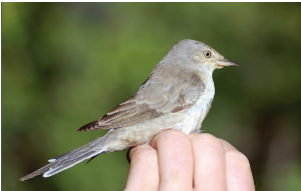
16. Fauvette épervière Sylvia nisoria , 1 er hiver, Camargue, novembre 2013 (Samuel Hilaire). First-winter Barred Warbler.