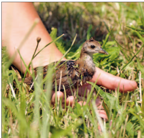
6. Marouette de Baillon Porzana pusilla , juvénile, Saône-et-Loire, juillet 2013 (Alexis Réveillon). Juvenile Baillon's Crake .