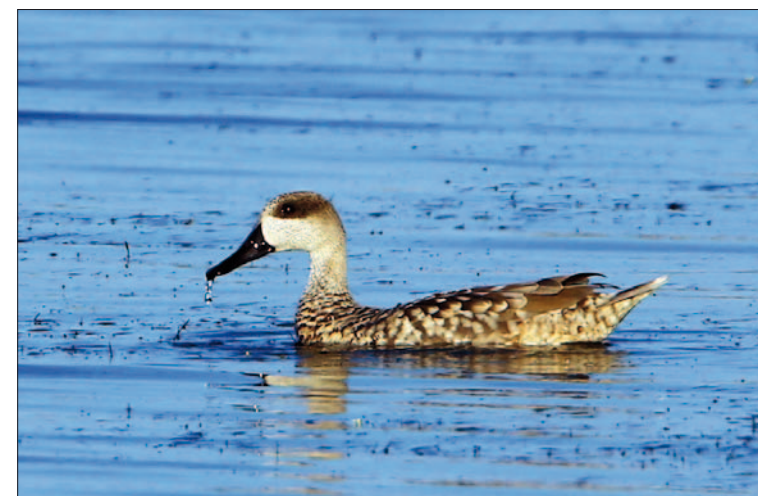
3. Sarcelle marbrée Marmaronetta angustirostris , mâle, Hyères, Var, août 2013 (Aurélien Audevard). Male Marbled Teal.

(Amérique du Nord). Quatre données et quatre individus sont une bonne année puisque la moyenne annuelle est d'un oiseau depuis la première observation en 1993. La Charente-Maritime et le Loiret accueillent leur premier Fuligule à tête noire. Notons que l'individu observé au lac de Grand-Lieu n'est pas moins que la seizième donnée de femelle déterminée en France.