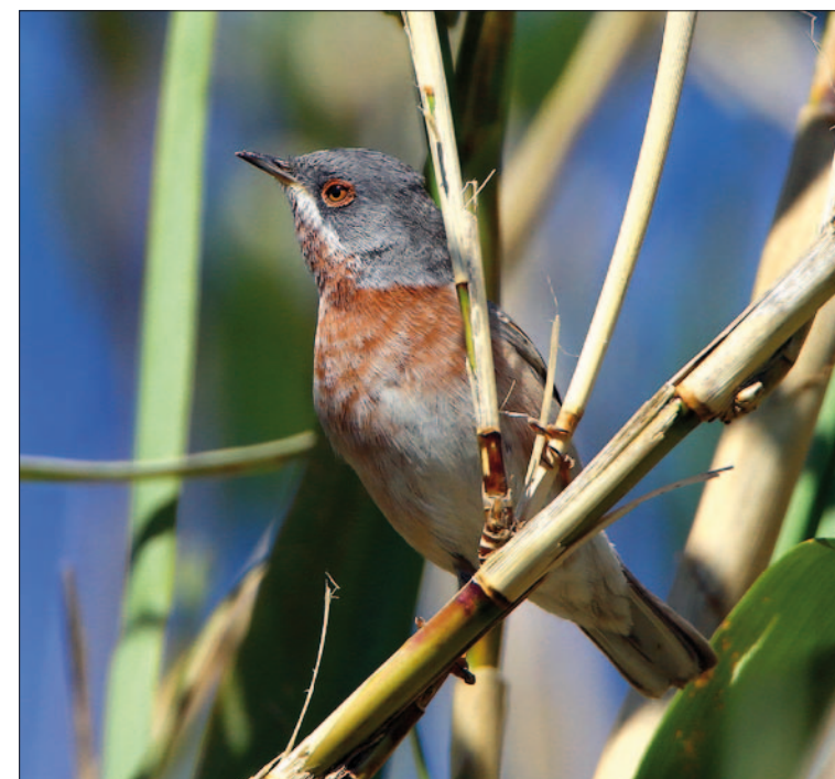
1. Fauvette des Balkans Sylvia cantillans , mâle, Hyères, Var, mars 2015 (Aurélien Audevard). Male Eastern Subalpine Warbler.