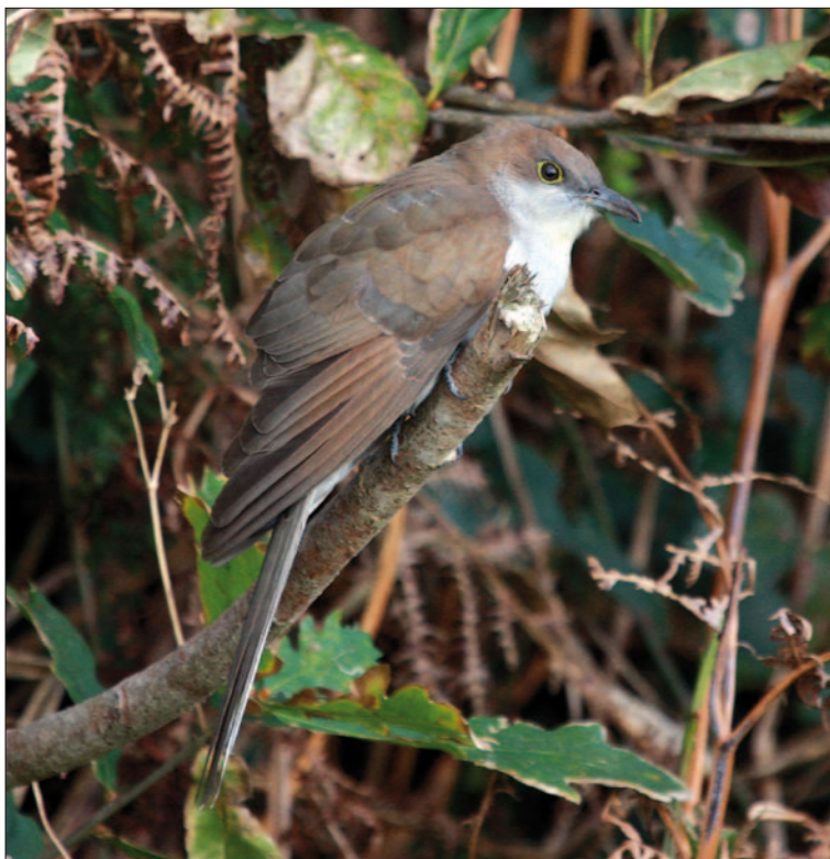
12. Coulicou à bec noir Coccyzus erythrophthalmus , 1 er hiver, Brélès, Finistère, novembre 2013. First-winter Black-billed Cuckoo .

(Afrique du nord-ouest à l'Asie centrale et au Pakistan, Afrique orientale). Deuxième observation française, à l'automne cette fois-ci, après l'oiseau capturé en Haute-Corse le 13 mai 2001.