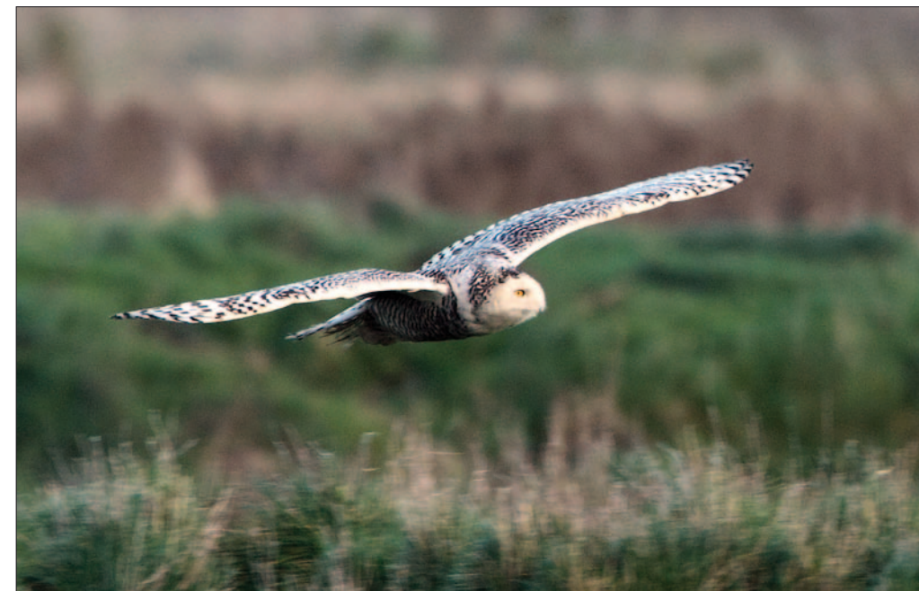
13. Harfang des neiges Bubo scandiacus , Charente-Maritime, janvier 2014 (Fabrice Jallu). Snowy Owl .