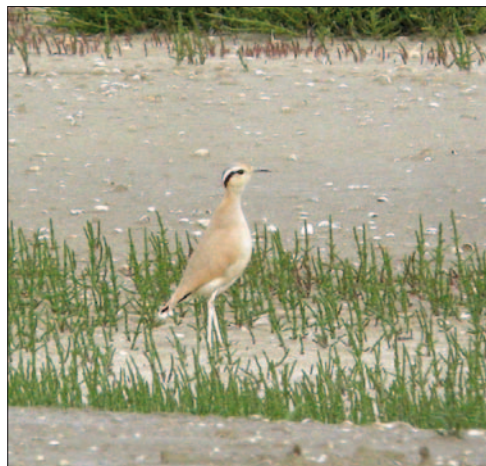
7. Courvite isabelle Cursorius cursor , adulte, Aude, juin 2013. Adult Cream-coloured Courser .

Saône-et-Loire – Saint-Maurice-en-Rivière: le Perthuis de la Lampe, juv. non volant, capt. et phot., 22 juillet (B. Grand, A. Réveillon, S. Horent et al. ).