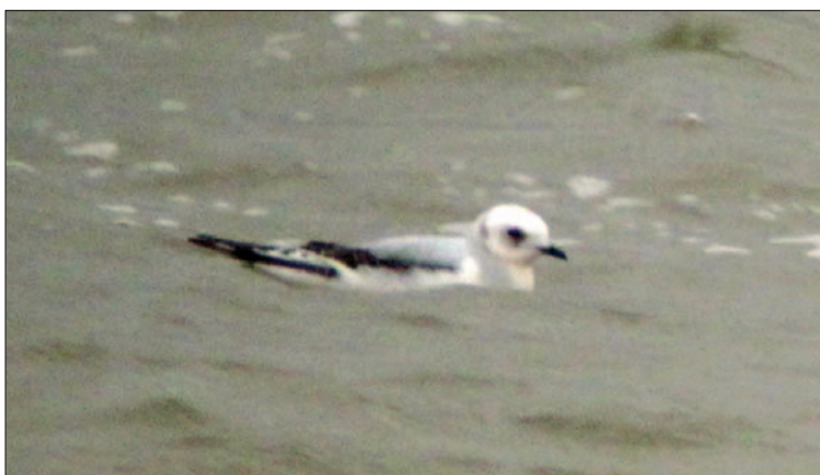
2. Mouette de Ross Rhodostethia rosea , 1 er hiver, Saint-Pierre-de-Bœuf, Loire, novembre 2013 (Vincent Palomares). First-winter Ross's Gull.

Le nombre de canards néarctiques a été particulièrement élevé en 2013. Pour n'en citer que quelques-uns, il y a eu pas moins de 11 Canards à front blanc Anas americana dont 9 ensemble ce qui est un record. Il y a également eu 8 Sarcelles à ailes vertes Anas carolinensis et 4 Fuligules à tête noire Aythya affinis . Par ailleurs, l'Oie rieuse du Groenland Anser albifrons flavirostris fournit une cinquième mention. Un record de présence a été noté pour le Grèbe à bec bigarré Podilymbus podiceps qui a séjourné 211 jours en Crau. Il y a eu quatre données d'Albatros à sourcils noirs Thalassarche melanophris et 13 données de Bergeronnette des Balkans Motacilla flava feldegg . Une nouvelle preuve de reproduction de la Marouette de Baillon Porzana pusilla a été obtenue. Par ailleurs, les premières mentions de Coulicou à