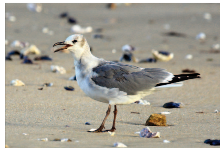
11. Mouette atricille Larus atricilla , 2 e année, Vendée, novembre 2013 (Yann Brilland). 2nd-yr Laughing Gull.

(Arctique, Atlantique Nord). Sixième observation dans la Manche à une date classique. Les observations homologuées tardivement par le CHN portent à quatre le nombre de données concernant cette espèce en 2009 et trois en 2008. Par ailleurs, il y aura eu deux oiseaux différents en décembre 2008 dans le terminal pétrolier d'Antifer.