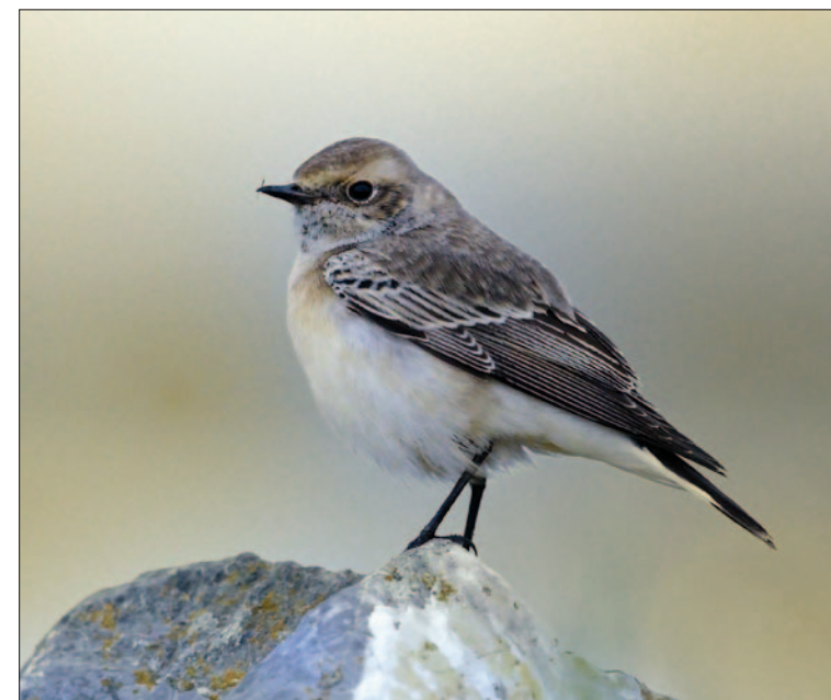
15. Traquet pie Oenanthe pleschanka , mâle 1 er hiver, Anglet, Pyénées-Atlantiques, novembre 2013. First-winter male Pied Wheatear.

(Iran, Asie centrale, Mongolie). Une huitième mention provenant du Finistère et la seconde sur l'île de Sein à une date classique puisqu'il y a autant de données de septembre que d'octobre.