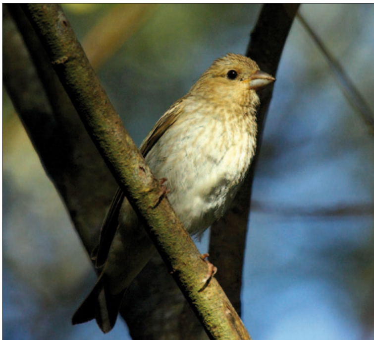
19. Roselin cramois Carpodacus erythrinus , 1 er hiver, Ouessant, octobre 2013 (Aymeric Le Calvez). First-winter Common Rosefinch .