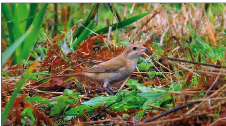
17. Pie-grièche isabelle Lanius isabellinus , 1 er hiver, île d'Hoëdic, Morbihan, novembre 2013 (Maxime Zucca). First-winter Isabelline Shrike .

(Sud-est de l'Europe et Sud-est de l'Asie). L'Étourneau roselin n'est plus soumis à homologation depuis le 1 er janvier 2013. Les données récoltées tardivement par le CHN ne montrent guère de changement quant au pattern d'apparition de l'espèce chez nous, si ce n'est cette seconde mention pour les Hautes-Alpes qui concerne tout de même trois individus.