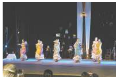
Pátio Espanhol encantou o público com a dança flamenco