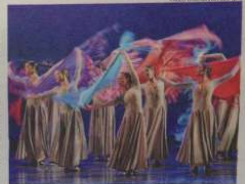
Ballet Jovem apresentará três coreografias próprias no espetáculo

Ela também comenta as coreografias da apresentação. "Cantares" é uma peça com oito mulheres, que fala do universo feminino e