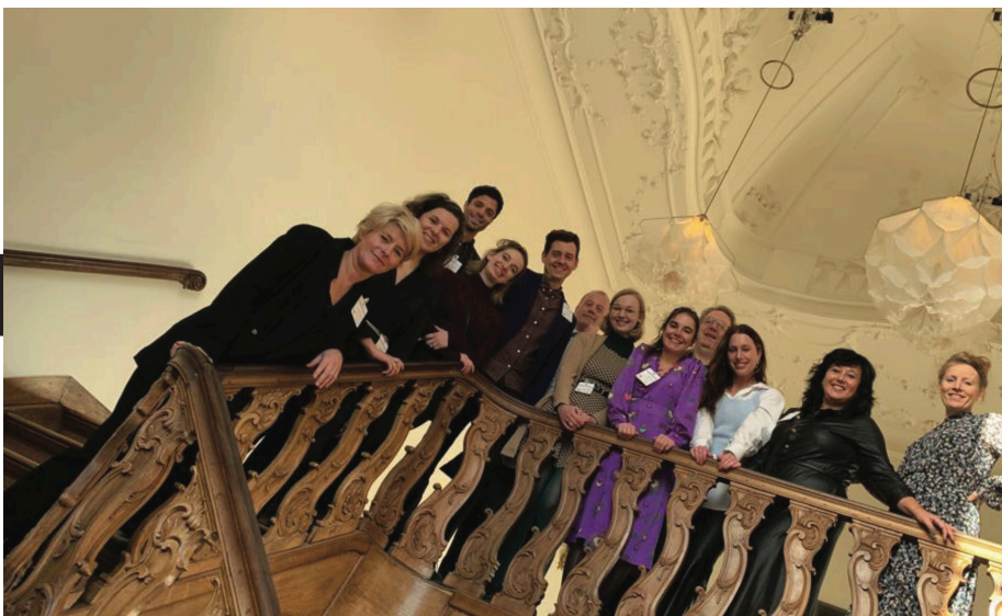
Het personeel van 2022

CJP sluit 2022 af met een positief saldo op het boekjaar van € 35.683. Het resultaat wordt toegevoegd aan het eigen vermogen van CJP.