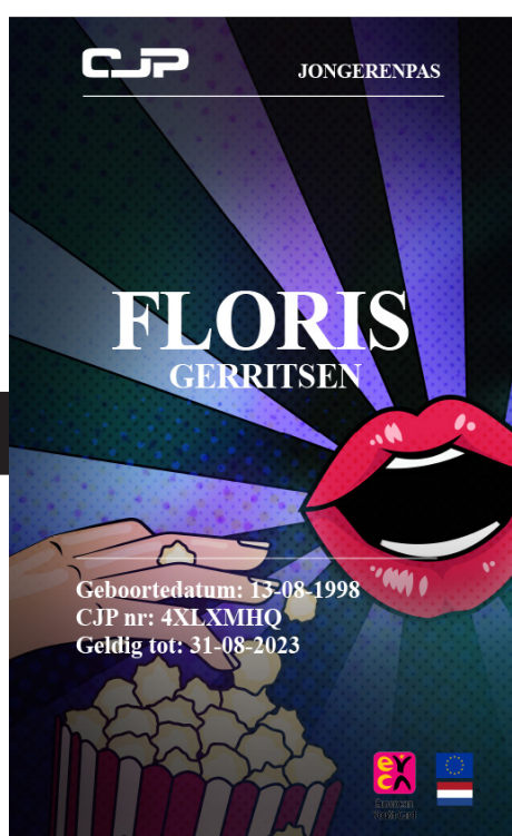
De digitale CJP-pas

In totaal hebben 1,2 miljoen jongeren in Nederland de beschikking over een CJP-pas.