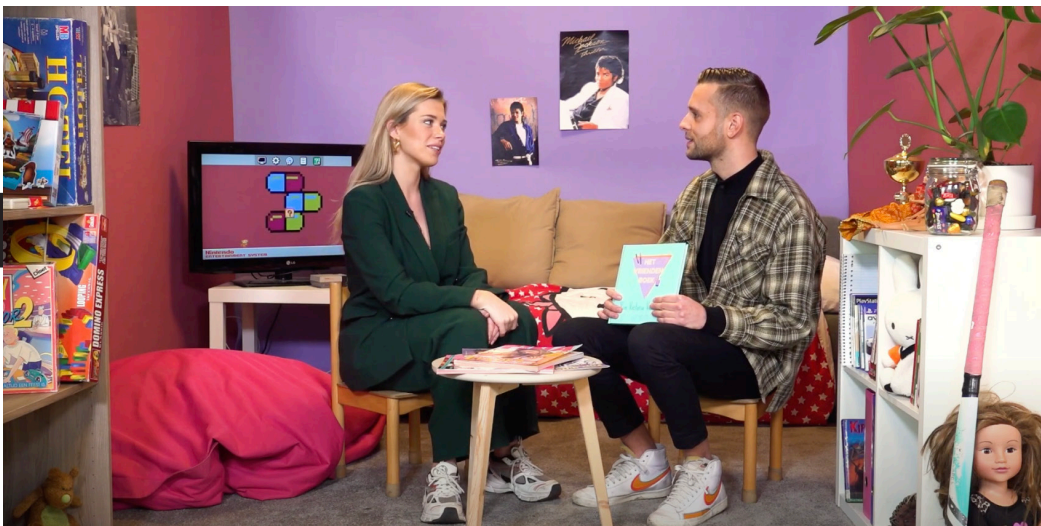
'Het Vriendenboek' op Youtube in samenwerking met Club Next

Club Next heeft een kerngroep jongeren met een grote diversiteit wat betreft woonplaats, leeftijd, etniciteit. Met hen sparren we en kijken we naar wat er nu speelt in hun omgeving. Daar pakken we diverse thema's uit en maken we content over. Het doel daarvan is om jongeren tot nadenken aan te zetten over het onderwerp. Wij willen een mindset creëren die bezig is met de toekomst; wat voor gevolgen nú heeft op later. Onze doelgroep herkent zich in de onderwerpen die we aansnijden en wij sporen ze aan tot actie. Ook willen we met dit platform verbinden en interactie stimuleren. Dit hebben we in 2022 gedaan met het videoformat Het Vriendenboek.