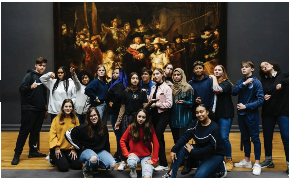
Mbo klas in het Rijksmuseum

Er werden voor dit bedrag door 1166 actieve culturele instellingen verspreid over heel Nederland 10.663 weborders aangemaakt voor in totaal 1.126.450 activiteiten. De meeste weborders werden door instellingen in Noord- en Zuid-Holland aangemaakt. Noord-Holland en Overijssel inden het meeste Cultuurkaartbudget.