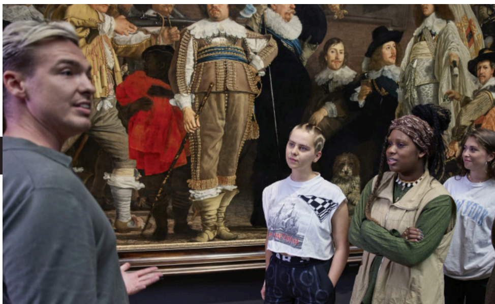
Middelbare school klas in het Rijksmuseum

Voor CJP was 2022 een goed jaar. Zowel de Cultuurkaartbestedingen als de ontwikkelingen rond de pilot MBO Card waren positieve ontwikkelingen. Maar CJP moet ook opnieuw opbouwen. Na 2 jaar Corona zijn er flinke gaten geslagen in onze bereik naar individuele jongeren. Die opbouw kon pas na de zomer werkelijk worden opgestart, en behoeft ook nog steeds aandacht.