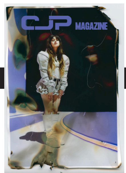
Het digitale CJP Magazine